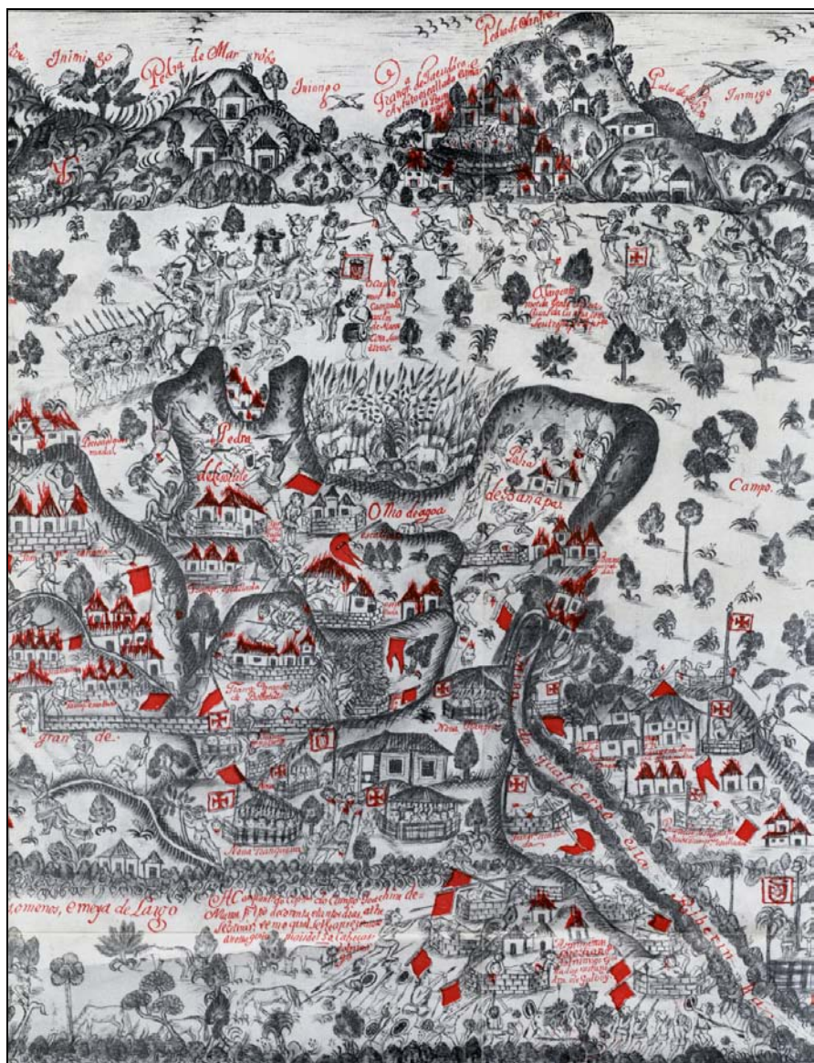
Extracto da Planta do Cailaco

Planta da região de Timor entre as ribeiras de Lois, Lamaquitos e Marrobo representando a tomada da Pedra do Cailaco, 1727