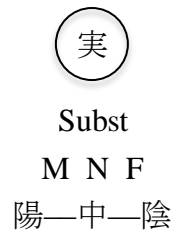
Fig 2. Les trois genres grammaticaux et leurs équivalents sino-japonais

Revenons au tableau récapitulatif de Nakano, pour nous concentrer sur sa partie inférieure reprise sur la figure 2 ci-dessous :