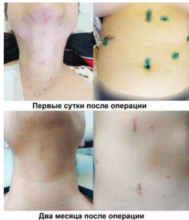
Рис. 4. Пациентка, оперированная по поводу синдрома МЭН 1, на первые сутки и через 2 месяца после операции.

Возвратный гортанный нерв (ВГН) был визуально определен при гемитиреоидэктомии в 7 случаях, при тиреоидэктомии в 2 случаях – билатерально, в одном случае – с одной стороны, при паратиреоидэктомии – в обоих случаях. В одном случае тиреоидэктомии по поводу диффузного токсического зоба отмечен парез ВГН с восстановлением голосовой функции через 2 месяца после операции. Гематома в проекции удаленной доли отмечена в одном случае – регрессировала на фоне консервативных