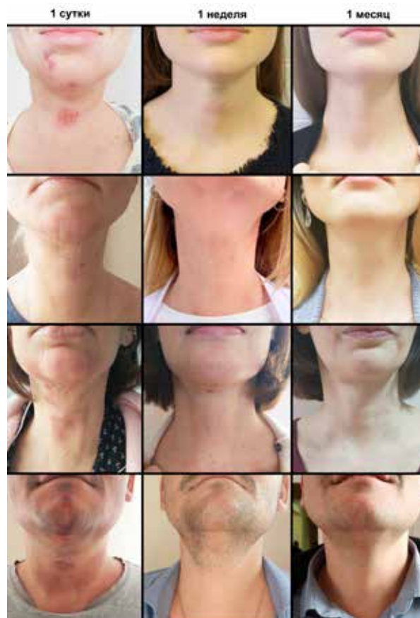
Рисунок 5. Пациенты, оперированные трансоральным доступом, на первые сутки, через неделю и месяц после операции.