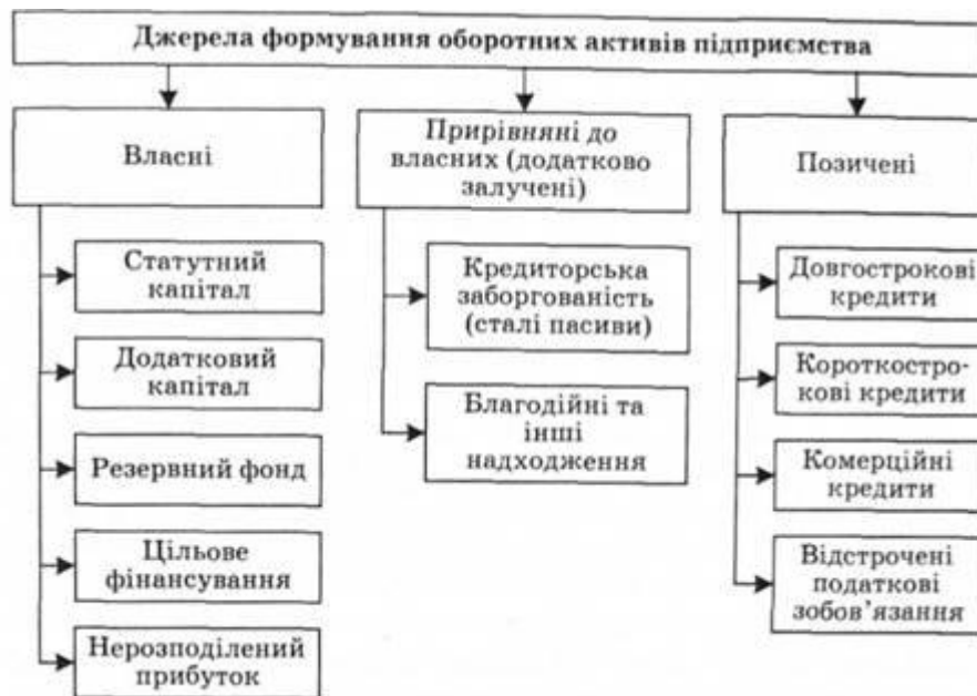
Рис. 1.1. Джерела формування оборотних активів підприємства

джерел нині економічно недоцільно, оскільки це знижує можливості підприємства щодо фінансування власних витрат і збільшує ризик виникнення фінансової нестабільності підприємства. У такому разі підприємство вимушене звертатися до позичання і залучення фінансових ресурсів у вигляді короткострокових кредитів банку та інших кредитів, комерційного кредиту, кредиторської заборгованості.