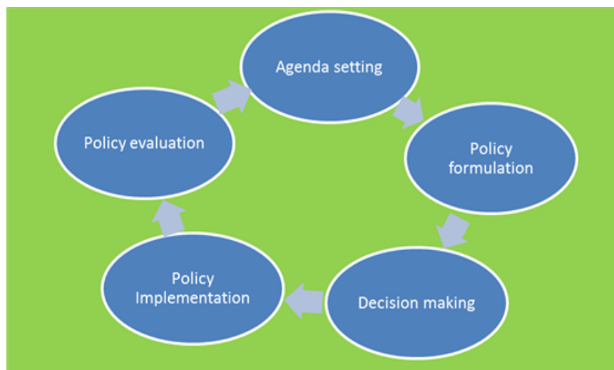
Rajah 1: Kerangka Teori Kitaran Dasar

Howlett dan Ramesh (1995) menyatakan, policy cycle atau Teori Kitaran Dasar terbahagi kepada lima peringkat iaitu pemilihan agenda ( Agenda setting ), memformulasikan dasar ( Policy Formulation ), pembuatan keputusan ( Decision Making ), pelaksanaan dasar ( Policy Implementation ) dan penilaian dasar ( Policy Evaluation ). Pemilihan agenda ( Agenda setting ) adalah merujuk kepada proses memilih daripada isu-isu yang disenaraikan dan pihak kerajaan perlu memberi perhatian kepada isu yang utama. Memformulasi dasar ( Policy Formulation ) pula merujuk kepada proses mengenal pasti strategi, formula dan mekanisme yang sesuai bagi memilih pemilihan dasar yang dibuat oleh kerajaan. Pembuatan keputusan ( decision making ) merujuk kepada kerajaan mengambil keputusan sama ada untuk membuat tindakan atau tidak mengambil tindakan.