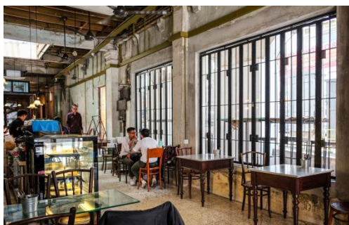
Rajah 1: Mingle and Leaf & Co

Transformasi boleh dilakukan dalam pelbagai aspek sebagai contoh transformasi digital, pendidikan, pengurusan, kepimpinan dan termasuklah terhadap bangunan atau monumen warisan bersejarah. Transformasi bangunan warisan bukan sesuatu yang asing pada abad ini, terdapat banyak bangunan warisan atau sejarah yang telah ditransformasikan dan diubahsuai menjadi muzium, pejabat kerajaan, restoran, cafe dan kedai buku dan hotel. Menurut Melville dan Gordon (1992) dalam (Mootar, 2019) menyatakan bahawa fungsi bangunan yang sering diubah adalah daripada sebuah pejabat menjadi rumah kediaman, bangunan industri diubah menjadi pusat pameran, rumah kedai dijadikan cafe , istana lama dijadikan muzium, pejabat dijadikan cafe , dan rumah agam dijadikan hotel. Walau bagaimana pun, keaslian bangunan tersebut masih dikekalkan. Transformasi ini juga telah merencanakan lagi nadi industri pelancongan dalam negara ini.