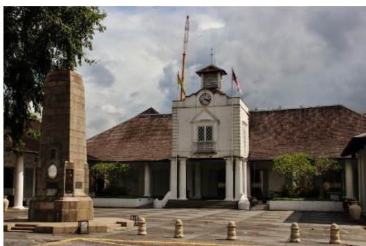
Rajah 2: The Old Courthouse , Sarawak (1924) dan Kota A Famosa, Melaka (1511)

Fielden (1994) berpendapat sekiranya sesebuah bangunan itu telah bertahan sehingga 100 tahun usia penggunaannya, sewajarnya diiktiraf sebagai monumen atau bangunan bersejarah. Malaysia juga kaya dengan warisan monumen dan bangunan bersejarah, kebanyakan daripada monumen atau bangunan bersejarah ini telah disenaraikan sebagai monumen atau bangunan warisan dan ianya telah dibina di antara tahun 1800 hingga 1900. Sesebuah bangunan itu boleh digelar sebagai bangunan warisan sekiranya ia mempunyai nilai seperti seni bina, estetik, sejarah, dokumentari, arkeologi, ekonomi, sosial, politik, rohani dan simbolik.