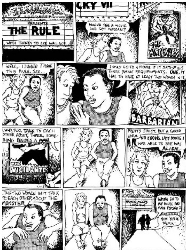
Figura 1. Tira cómica que dio origen al test.

tor o un género cinematográfico, y obtenemos un alto número de ellas que no pasa el test, resulta razonable interpretar los resultados en términos de desigualdad de género. Al ser un test muy poco exigente, permite poner de relieve la poca participación femenina en la ficción cinematográfica. Basados en su relativa sencillez, y en el potencial que tiene este test para mostrar, en términos estadísticos, el lugar de la mujer en el cine, decidimos desarrollar una versión computacional del mismo. Creemos que este desarrollo tiene principalmente dos ventajas respecto al sitio web bechdeltest.com . Por un lado, permite analizar un gran número de películas al mismo tiempo, y comparar los resultados obtenidos en función de distintos parámetros (género, director, fecha de producción, país de procedencia). En segundo lugar, permite hacer el análisis sobre un conjunto de películas que puedan resultar una muestra verdaderamente representativa de un grupo. Por el contrario, la base de datos del sitio web crece con el constante aporte particular de los usuarios, que puede tener diferentes tipos de sesgos. Luego de una exhaustiva búsqueda, no hemos encontrado ningún desarrollo similar, por lo que creemos que puede resultar una innovación significativa.