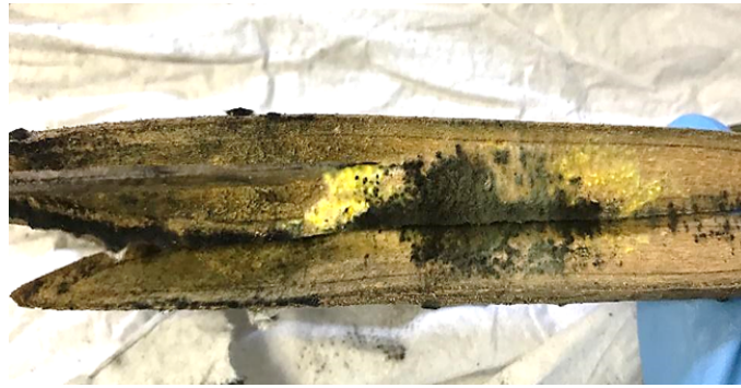
Figura 1. Lesiones asociadas con la presencia de hongos en tallos de manglares.