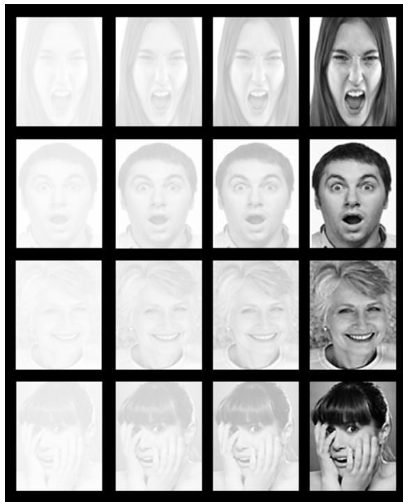
Figura 1. Imágenes utilizadas en el estudio, cada una con sus cuatro niveles de contraste

Una vez seleccionadas las imágenes, se editó su tamaño y los niveles de contraste. La dimensión final de las imágenes fue de 149x189 píxeles. Finalmente, se manipularon los niveles de contraste para todas ellas, y se obtuvieron cuatro versiones de cada imagen (ver figura 1), de acuerdo con el grado de porcentaje de contraste en la imagen (10%, 20%, 30% y 100%).