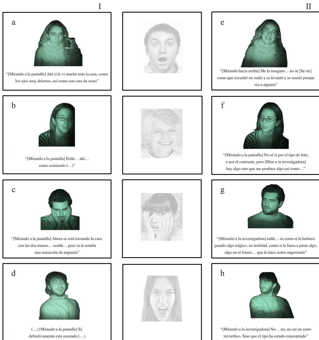
Figura 4. Respuestas comprensivas y respuestas hipotéticas

de las manos, la forma de la boca, la posición de la cabeza, etc. Cabe destacar que en numerosas ocasiones los participantes suelen responder expresando que no pueden decir qué vieron con exactitud, a pesar de que son capaces de informar según ‘la percepción que tienen de lo que pudo haber sido’. En estos casos, siempre reportan detalles parciales o pequeños que resultan coincidentes con la imagen propuesta.