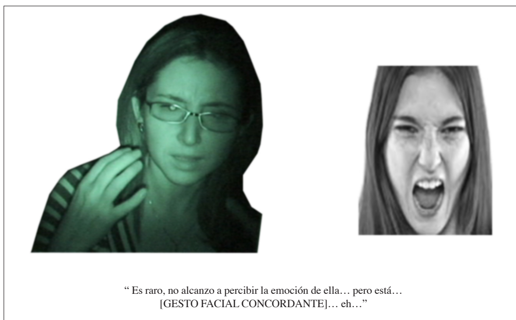
Figura 5. Comprensión pre-conceptual

Por otro lado, la figura 5 muestra cómo en momentos de ausencia de claridad y certeza de la imagen, si bien puede existir una correspondencia del gesto de la participante con el de la imagen presentada, no siempre los participantes son capaces de adjudicar una emoción precisa al estímulo.