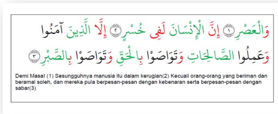
Gambar 3. Contoh penggunaan warna primer dalam pembelajaran surah al-‘Aṣr

Pembahagian perkataan di dalam al-Quran menggunakan tiga warna primer atau warna asas iaitu hijau, merah dan hitam bagi setiap perkataan. Warna hijau mewakili al-isim (kata nama), merah al-ḥarf (kata sendi) dan hitam al-fi’il (kata kerja). Seperti yang didapati dalam Gambar 3 di atas. Perkataan yang diwarnakan dengan hijau itu adalah tergolong daripada kata nama, seperti al-‘aṣr , al-insān , khusr , alladzina , as-ṣāliḥāt , al-ḥaq dan as-ṣabr . Manakala perkataan yang berwarna merah adalah perkataan yang terdiri daripada kata sendi yang pelbagai, seperti waw al-Qasm , inna , la fi , illā , waw al-ʿatf dan ḥarf jār . Selain itu perkataan yang merupakan kata kerja menggunakan warna hitam iaitu āmanū , ‘Amilū dan tawāṣau . Oleh itu para pelajar akan dapat membezakan dengan lebih mudah setiap jenis perkataan dan dapat mengenalpasti dengan pantas perbezaan ketiga-tiga jenis perkataan ini.