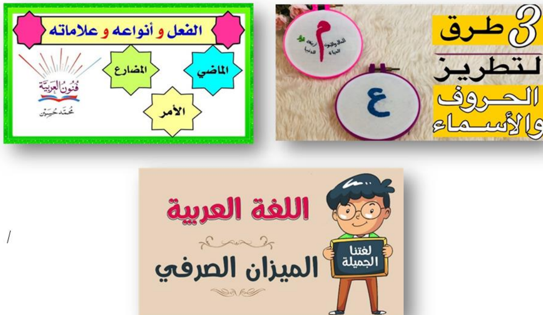
Gambar 6. Kalendar Perkataan (Taqwīm al-Kalimāt)

Kad Kunci Perkataan seperti dalam Gambar 6 ini adalah sebuah kad atau kalendar yang mengumpulkan al-harf dan al-ism yang wajib diketahui oleh pelajar. Pada permulaan pengajaran, pelajar akan didedahkan dengan mengenal perkataan al-harf dan al-ism yang menjadi syarat wajib untuk mereka kenal sebelum mengenal tajuk-tajuk yang lebih besar. Kad ini penting bagi mereka sebagai rujukan pada setiap kali kelas berlangsung. Selain itu, kad ini juga mengandungi jadual mudah bagi mereka untuk mengenal al-fi'l serta perubahan-perubahannya. Tambahan pula, kalendar perkataan ini mengandungi rujukan mudah bagi wazan atau formula morfologi yang disusun mengikut susunan bernombor.