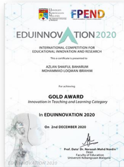
Gambar 7. Pengiktirafan di pertandingan inovasi yang berkaitan dengan modul yang dibangunkan