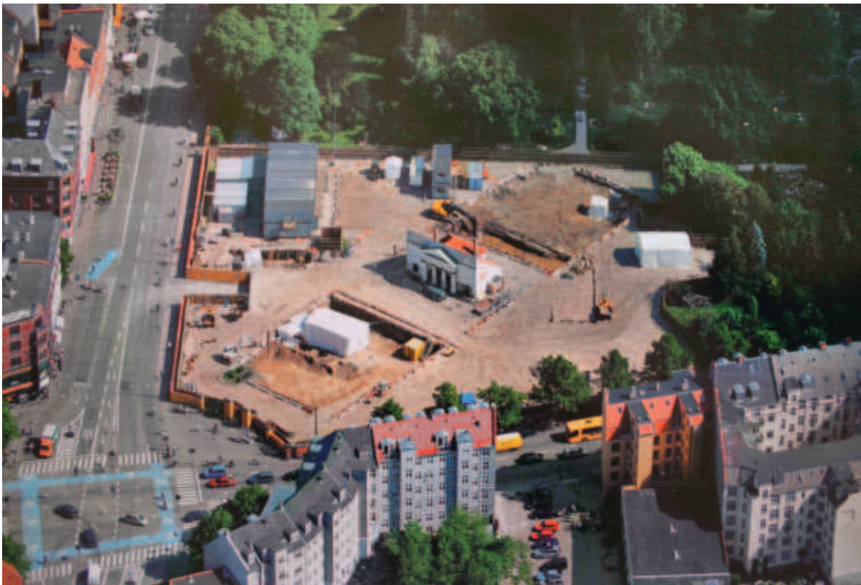
Fig. 3. Udgravning af Assistens Kirkegård i København med begravelser fra 1800- og 1900-tallet.

livet og mennesket i de efterreformatoriske perioder, og set i sammenhæng med den øvrige materielle kultur kan vi her få informationer om det enkelte menneske og dets etnicitet, ernæring, forurening og livsvilkår.