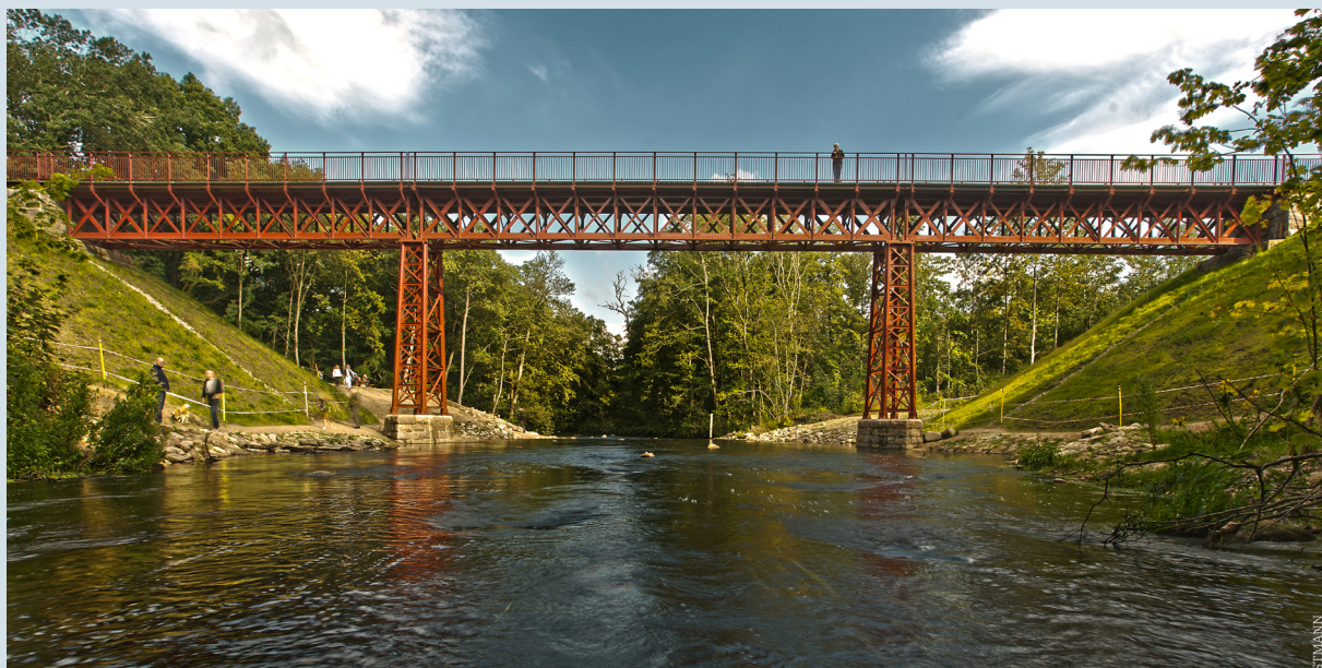
Fig. 3 b. Den genfundne bro i Vestbirk efter restaurering.