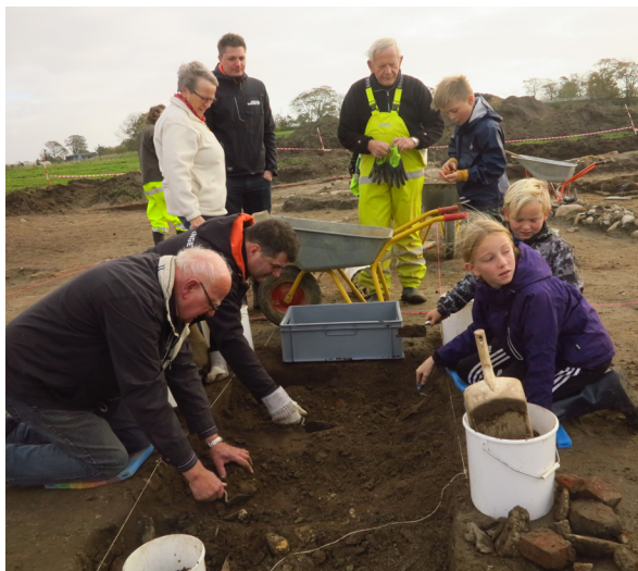
Fig. 5. Professionelle og borgere i koncentreret samarbejde om udgravningen af fattiggården på Firgårde.

82.000 besøgende i 2016 ifølge Horsens Folkeblad 11. juni 2017. 4