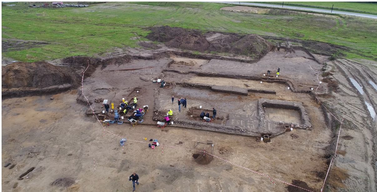
Fig. 1. Oversigtsbillede fra udgravning af en fattiggård fra 1880-1916.

tisk pres. Det er dog min erfaring, at befolkningen generelt er lige interesseret i de arkæologiske undersøgelser, uanset om de er fra før eller efter 1536. Det er måske endda sådan, at publikum lettere kan forstå undersøgelser, som foretages af materiale, som kan relateres til en nutidig sammenhæng.