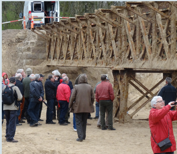
Fig. 3 a. Den genfundne bro under udgravning.