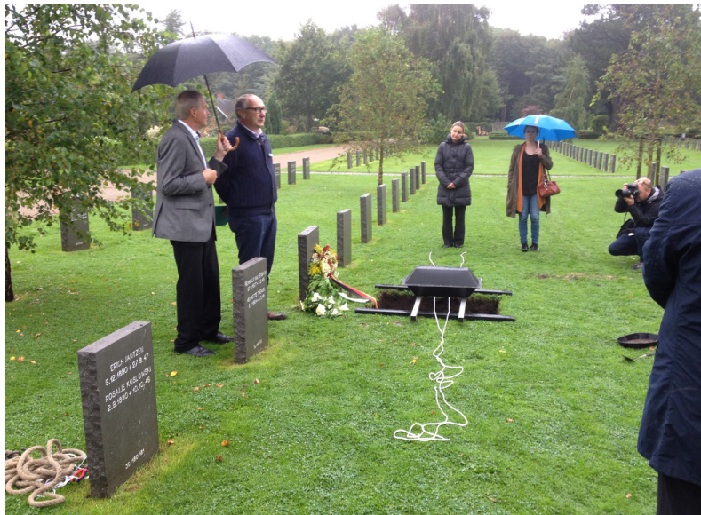
Fig. 6. Piloten Hans Wunderlich begravet på Søndre Kirkegaard i Aalborg i 2017.

var utrolig dedikerede og hårdtarbejdende og supplerede fagarkæologernes arbejde på bedste vis. Derudover fremkom et righoldigt fundmateriale med mange interessante oplysninger. Resultaterne er foreløbig publiceret i Museum Skanderborgs årbog for 2017 og kommer til at danne grundlag for et arkæologisk speciale. 7 På baggrund af de foreløbige resultater ønsker museet at udgrave sidste del af anlægget til oktober 2018.