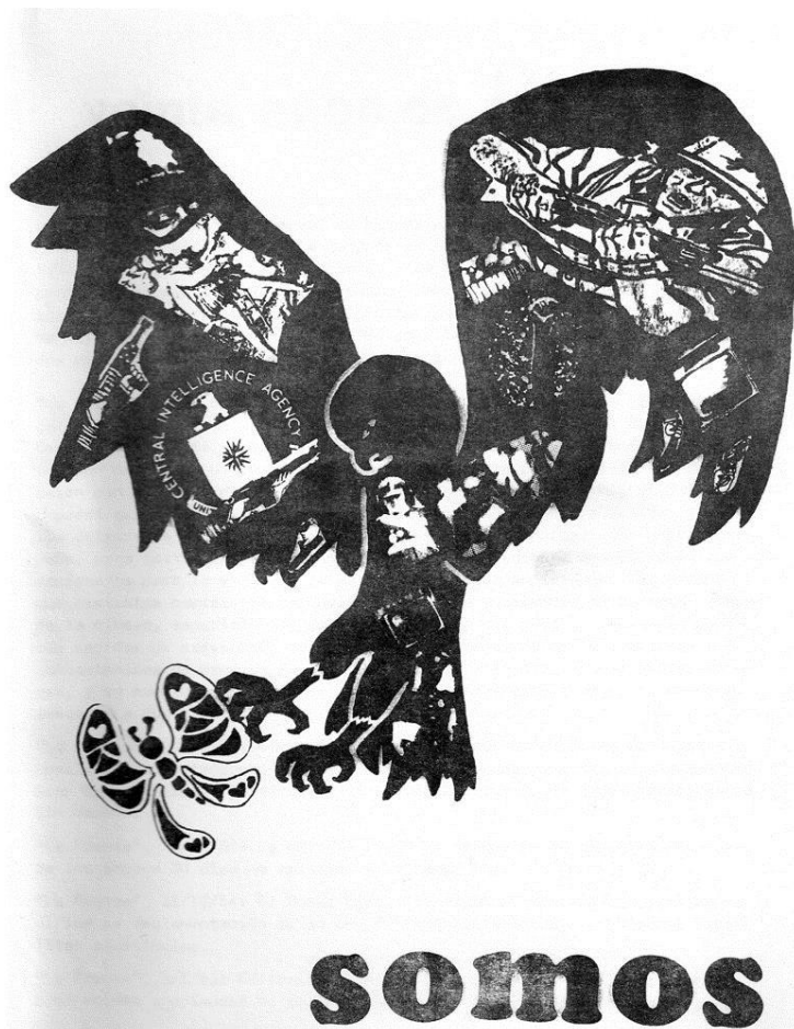
Imagen 4. Somos , núm. 5, 1974, Buenos Aires.

la estampa popular, eran utilizadas para señalar aquellos vocablos que, por un lado, los “oprimían”, pero de los cuales también pretendían apropiarse. El primer punto de su declaración de principios reclamaba sus derechos democráticos y constitucionales como “ciudadanos mexicanos que somos”, 70 e iba acompañada también por arte mural mexicano, una de las iniciativas pictóri-