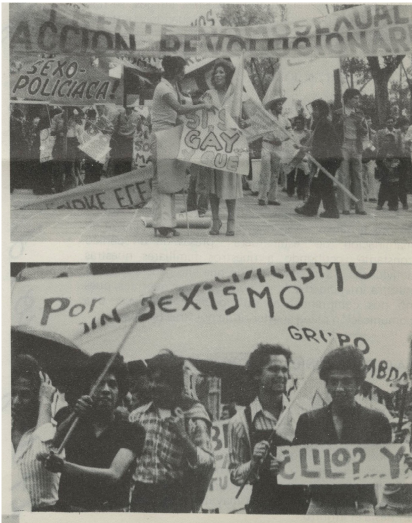
Imagen 3. Marcha por la dignidad homosexual, México, 1979, en CAMENA-UACM.