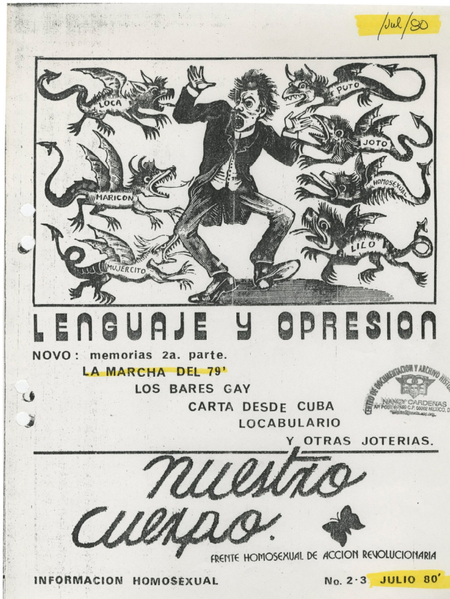
Imagen 5. Nuestro Cuerpo , núms. 2-3, 1980, en CAMENA-UACM.

para una revolución total”. 72 La reivindicación narrativa del afeminamiento en ilustraciones y la burla hacia la imagen idílica del varón viril promovido por la guerrilla funcionaban así como una crítica punzante hacia el corazón mismo de los horizontes de sentidos desplegados por la izquierda nacional.