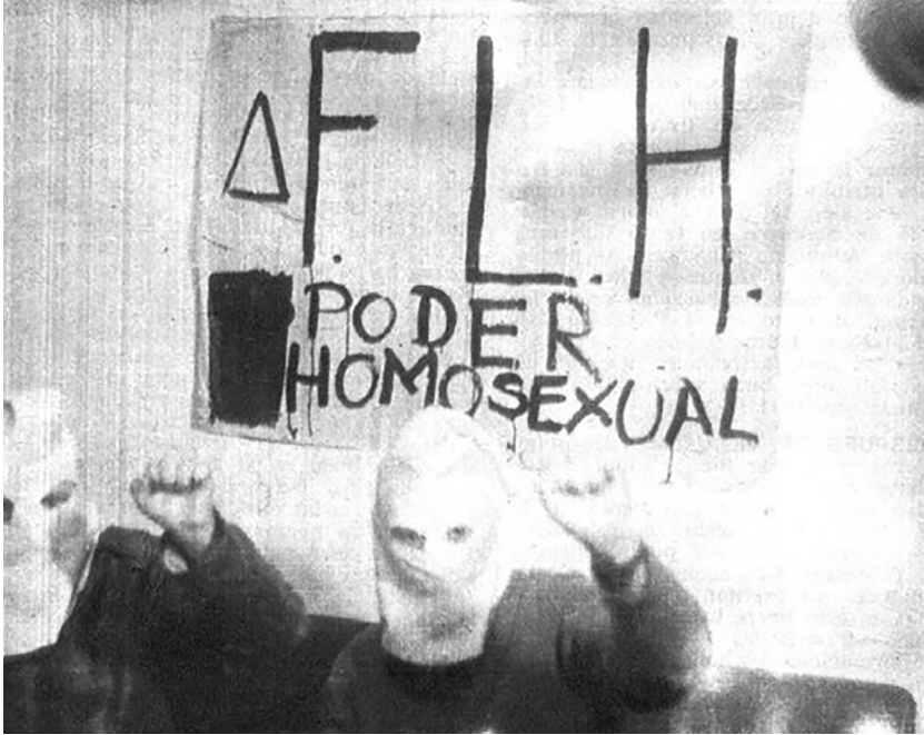
Imagen 2. Así , núm. 891, julio de 1973, Buenos Aires.

incipiente extensión del modelo de identidad irradiado por las capitales occidentales (véase imagen 3).