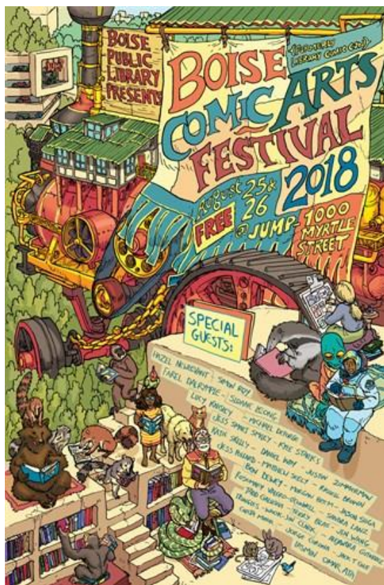
Imagem 7. Cartaz do evento Boise Comic Arts Festival

Nos EUA há dois bons exemplos de eventos anuais para fandoms , a Barry Public Library promove o BPL Comic Con e a Boise Public Library sedia o Boise Comic Arts Festival , ambos eventos contam com atividades como: cosplays , workshops , contação de história, concursos, palestra com autores, oficinas, entre outras. A Public Library of Brookline mantém um clube de fandoms com encontros semanais para fãs de diversos cânones compartilharem suas produções, obter inspiração, conversar sobre episódios favoritos, jogar diversos jogos, entre outras atividades. No Brasil, a Pública Biblioteca ‘Arthur Vianna’ promoveu, em 2017, o evento +Geek , entre suas atividades destacam-se: oficinas, rodas de conversa, desfile, gincanas, além de uma feira geek (gibis, produtos colecionáveis, produtos importados, games e players ).