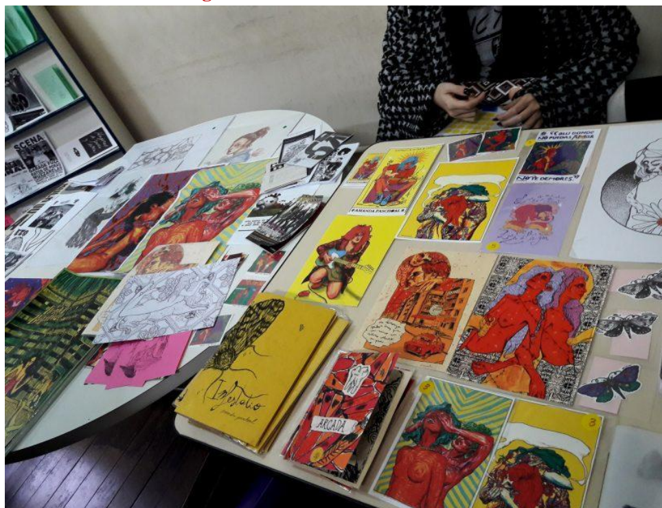
Imagem 1. Fanzines do AmericanaZINE