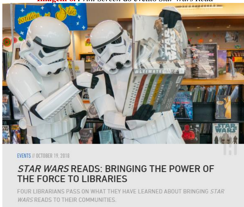
Imagem 6. Print Screen do evento Star Wars Read