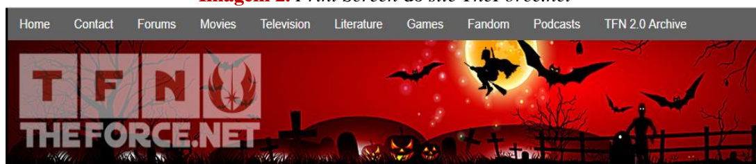
Imagem 2. Print Screen do site TheForce.net