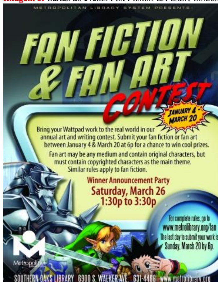
Imagem 5. Cartaz do evento Fan Fiction & Fanart Contest

No estado de Oklahoma, EUA, a Southern Oaks Library promove o concurso Fan Fiction & Fan Art Contest , voltado para todas as idades, o evento visa premiar as melhores fanfictions e fanarts por categoria, no site constam as diretrizes para se inscrever e as categorias por faixa etária.