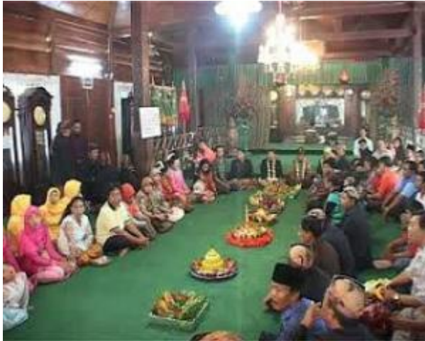
Tumpeng-tumpeng 1 Suro

Sehingga masyarakat mempersembahkan yang terbaik bagi Eyang Jugo, berupa persembahan sesaji.