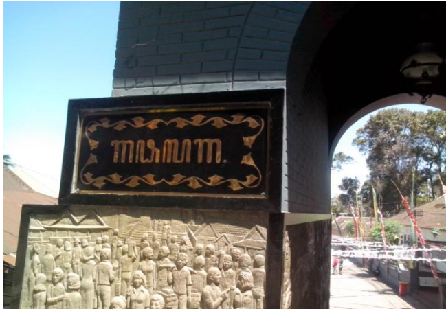
Relief di pintu masuk makam

klenteng. Terdapat perpaduan unsur budaya antara Jawa, Islam dan China di sekitar area makam Gunung Kawi, sehingga bisa digambarkan terdapat multikulturalisme budaya dibalik wisata religi Gunung Kawi.