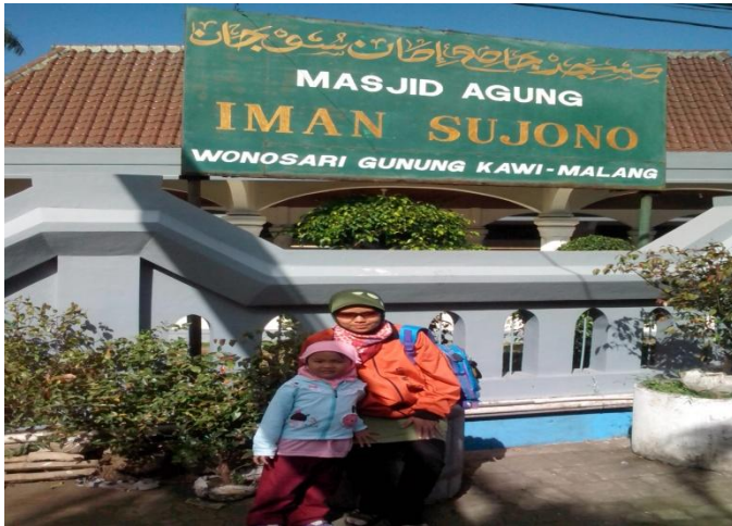
Masjid Iman Soedjono

tujuh kali, dengan setiap saat berhenti di depan pintu sisi utara, timur, selatan dan barat, sambil menghormat ke dalam makam.