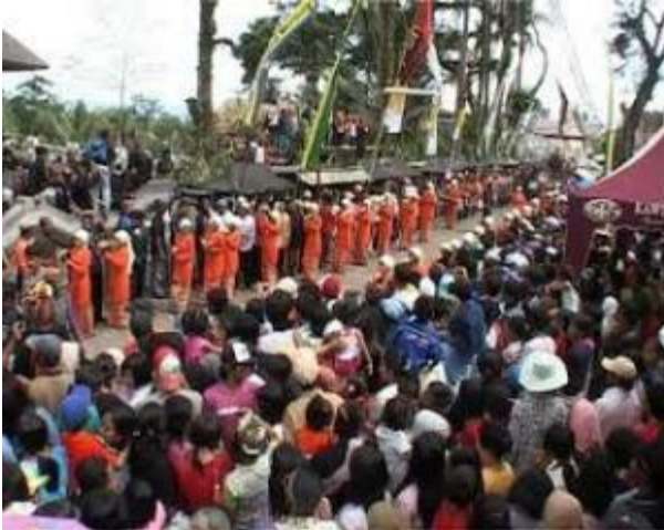
Ritual 1 Suro

Bagi masyarakat desa wonosari, ritual satu suro adalah wajib hukumnya. Selain menyangkut kelangsungan hidup masyarakat wonosari, ritual itu juga ditujukan untuk keselamatan masyarakat Kabupaten Malang. Ritual satu suro dimulai dengan arak-arakan kirab sesaji keliling desa kawasan Gunung Kawi. Dan diikuti oleh seluruh masyarakat sekitar Gunung Kawi. Para pesertanya tua muda memakai pakaian tradisional jawa. Berbagai atribut dan property turut menghiasi arak-arakan tersebut. Berbagai macam bahan makanan dan tumpeng hias menjadi pemandangan menarik dalam arak-arakan itu.