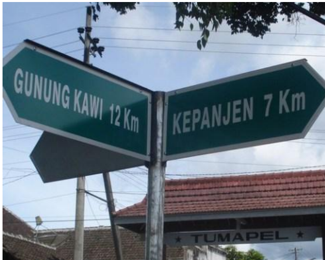
Petunjuk arah ke Gunung Kawi