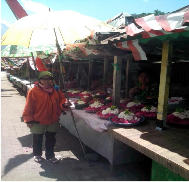
Kios-kios penjual bunga

pesarean berjejer kios-kios yang menjajakan bunga-bunga mawar untuk ditaburkan di makam atau untuk upacara-upacara peribadatan.