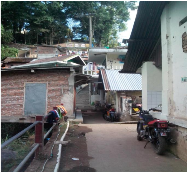
Tempat tinggal masyarakat Gunung Kawi

“...Biasanya para penyumbang adalah orang-orang yang mendapatkan rizki banyak, dan kemudian kembali lagi ke sini untuk menyumbangkan sebagian rizkinya...”