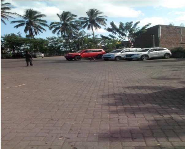
Suasana tempat parkir

sekitar Gunung Kawi semakin modern dengan berbagai pembangunan di sekitar wilayah Gunung kawi.