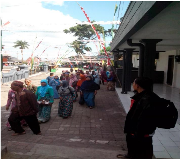
Para pengunjung makam Gunung Kawi