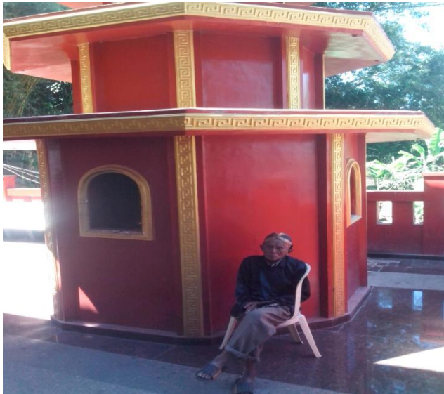
Petugas pembakaran dupa

kesempatan peneliti bertemu dengan beberapa orang petugas di areal makam juga memakai pakaian adat Jawa.