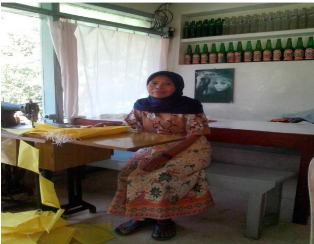
Pembuat kantong bunga layon

Beberapa masyarakat yang lain mendapatkan matapencarian sebagai guide , ojeg motor, tukang parkir, penjaga tempat-tempat persembahyangan dan beberapa areal pesarean, pengusaha transportasi, pengusaha hotel dan penginapan. Sebagian masyarakat di sekitar makam Gunung Kawi juga menyewakan rumah-rumah mereka untuk para pengunjung dan juga beberapa tempat mandi umum untuk para peziarah makam.