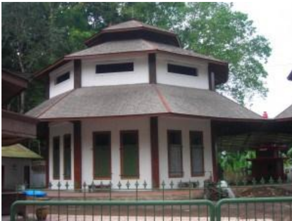
Kelenteng Ciam Si

Gunung Kawi adalah sebuah gunung berapi di Jawa Timur, yang berdekatan dengan Gunung Butak. Tidak ada catatan sejarah kapan terakhir Gunung Kawi meletus, sebagai daerah obyek wisata Gunung Kawi dijuluki sebagai "kota di pegunungan". Memasuki areal pemakaman Gunung Kawi pengunjung akan melihat pemandangan mirip di negeri Tiongkok jaman dulu. Di sepanjang jalan bisa ditemui arsitektur khas Tiongkok, terdapat sebuah kuil/klenteng tempat bersembahyang kepercayaan Kong Hu Chu. Terdapat Ciam Si, Ci Suak, hotel, dan beberapa tempat penginapan yang biasa disewa oleh para pengunjung.