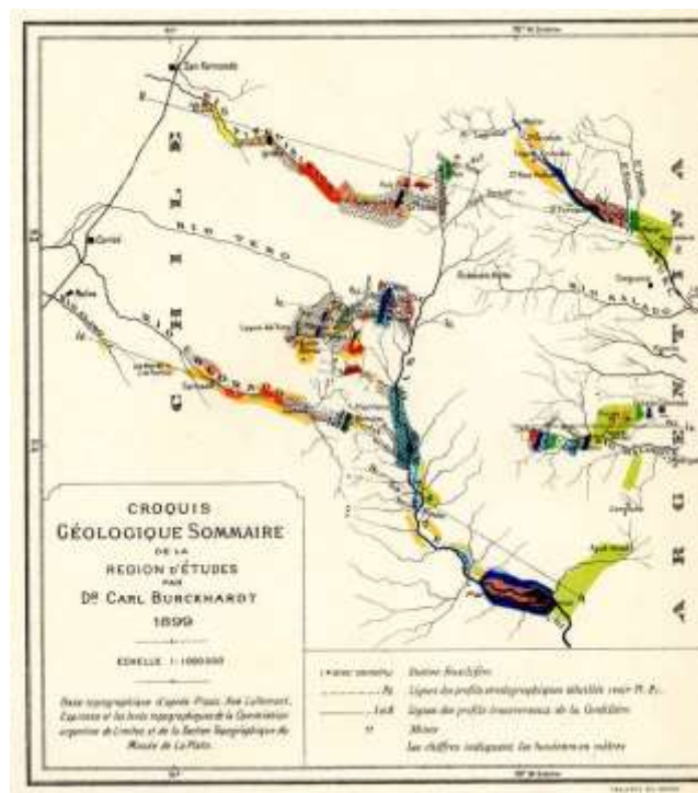
Fig. 12: Croquis esquemático de la región estudiada por Carl Burckhardt publicado en 1900 en los Anales del Museo de La Plata con indicación de las secciones transversales realizadas.

En esta localidad Palacio et al. (2016) han registrado amonites desde la Zona de Virgatosphinctes andesensis (Tithoniano temprano) hasta la base de Substeuerocheras koeneni (Tithoniano tardío). Los fósiles se encuentran depositados en la colección de paleontología del Museo de Ciencias Naturales y Antropológicas “Juan Cornelio Moyano” de Mendoza bajo los números MCNAM-PI 24612–24641. Para esta contribución, se identificaron amonites del Tithoniano tardío, de preservación pobre, pero no se reconocieron en el campo los bloques de calizas gris blanquecinas descritos en esta localidad por Burckhardt (1900, 1903) y que portarían amonites del límite Jurásico-Cretácico.