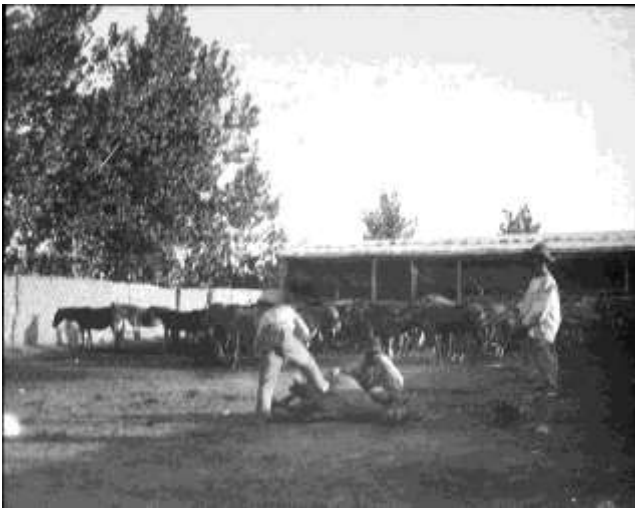
Fig. 3: En San Rafael herrando las mulas que se usarán en la expedición (original en vidrio, ETH-Bibliothek, Zurich).