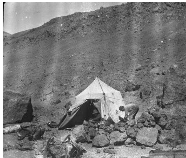
Fig. 11: Campamento en las cercanías del arroyo Valenzuela próximo a Mallines Colgados (original en vidrio, ETH-Bibliothek, Zurich).

En cuanto a la localidad de “Molinos Colgados”, Burckhardt (1900) la ubica sobre el sendero de mula que recorre la margen derecha del río Grande desde la desembocadura del arroyo Valenzuela hasta La Invernada (Fig. 11 y mapa de la Fig. 12). De ella describe amonites y bivalvos de edad tithoniana tardía y del límite Jurásico-Cretácico. El nombre de esta localidad es en realidad Mallines Colgados y en ella están pobremente expuestas pelitas negras de la Formación Vaca Muerta.