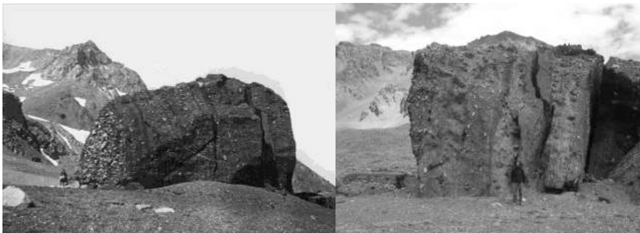
Fig. 7: Bloque de rocas piroclásticas en el paso del río Damas: A la izquierda en 1897 según Burckhardt (1900) y a la derecha foto actual mostrando los remanentes que aún permanecen.

Continúan su travesía, y después de una corta estancia en San Fernando, suben la cordillera nuevamente desde Chile por el mismo camino. De esta forma se reúnen a la tropa principal en el valle del río Tordillo, llegando al Puesto Santa Elena en Valle Hermoso (véase Fig. 8).