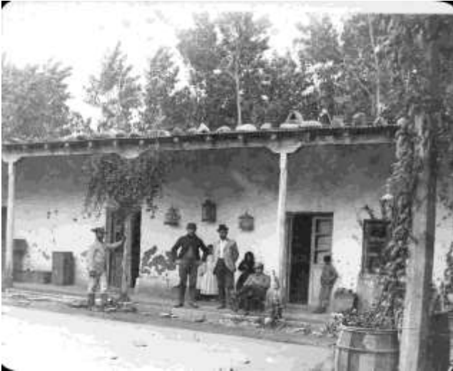
Fig. 2: Hotel en San Rafael donde se alojaron en 1897 (original en vidrio, ETH-Bibliothek, Zurich).