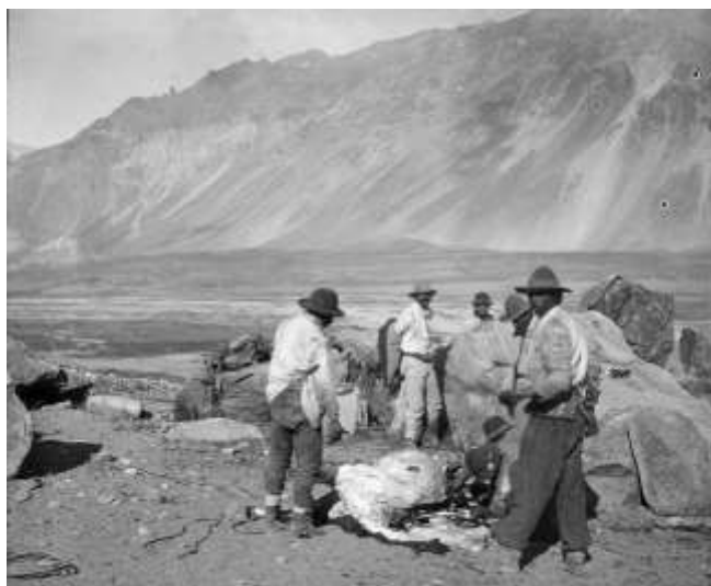
Fig. 8: Un descanso en el camino en Valle Hermoso carneando un vacuno. (original en vidrio, ETH-Bibliothek, Zurich).

Continúan su travesía, y después de una corta estancia en San Fernando, suben la cordillera nuevamente desde Chile por el mismo camino. De esta forma se reúnen a la tropa principal en el valle del río Tordillo, llegando al Puesto Santa Elena en Valle Hermoso (véase Fig. 8).