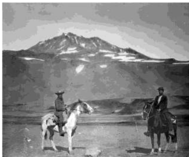
Fig. 9: Wehrli y Burckhardt al pie del Volcán El Planchón en las nacientes del río Grande (original en vidrio, ETH-Bibliothek, Zurich).

Es así que Moreno les da precisas instrucciones para estudiar las dos vertientes de la cordillera, una de ellas entre Curicó y San Rafael, y posteriormente un segundo perfil más al norte a lo largo del paso de la Cumbre o de Uspallata.