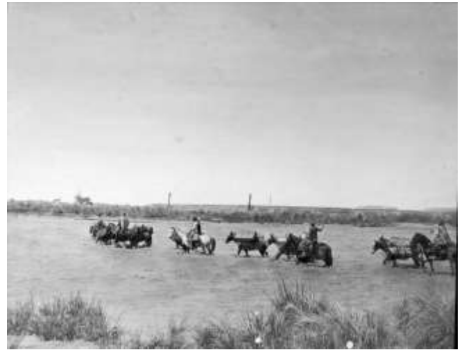
Fig. 5: Burckhardt y Wehrli a la salida de San Rafael cruzando el río Diamante en 1897 (original en vidrio, ETH-Bibliothek, Zurich).

La organización y los preparativos de esta expedición en San Rafael (véase Figs. 2 a 4) son tales que recién comienzan sus exploraciones en febrero, moviendo una tropa de 80 animales. Cruzan el río Diamante (Fig. 5) y se dirigen al valle del río Atuel. Recién el 6 de febrero establecen el primer campamento en el arroyo La Manga.