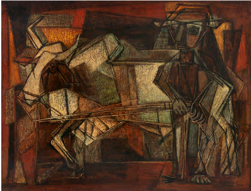
figura 3 Sin título. Oleo Sobre Tela. 1957.

Verónica Cremaschi, Una aproximación a la trayectoria profesional de la mendocina Rosario Moreno (1914c- 2010c) , pp. 359-399.