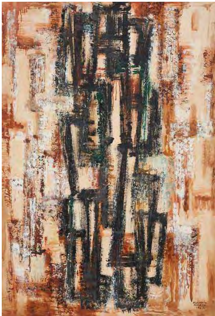
Figura 4. Rosario Moreno-sin título. Oleo sobre placa.1962.