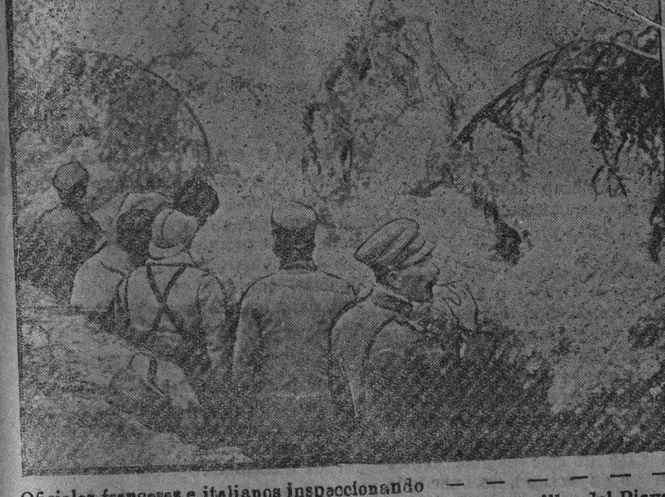
Oficiales franceses e italianos inspeccionando las primeras líneas a orillas del Piave