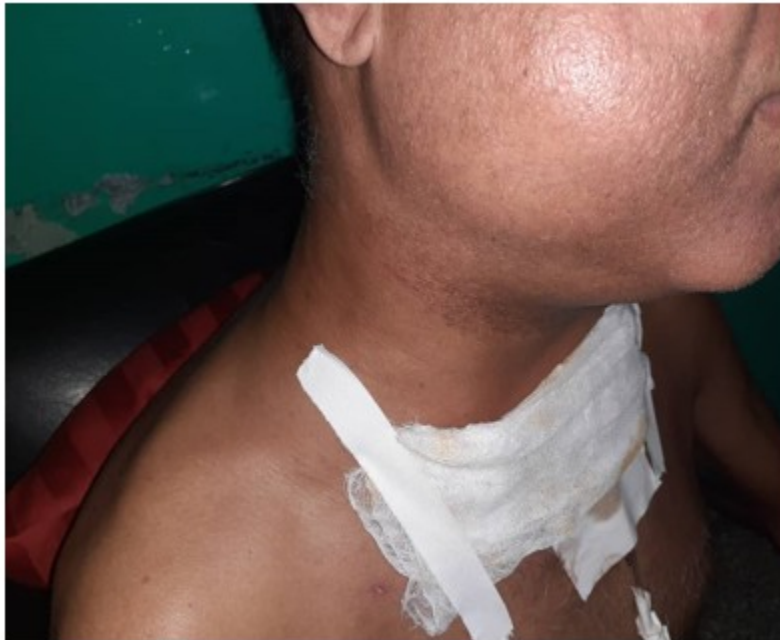
Fig. 2. Imagen que muestra el edema facial.

Posteriormente a las 48 horas de su egreso el paciente comienza con aumento de volumen de toda la cara el cuello y región supraclavicular. Se constata al examen físico presencia de enfisema celular subcutáneo. (Figura 2).