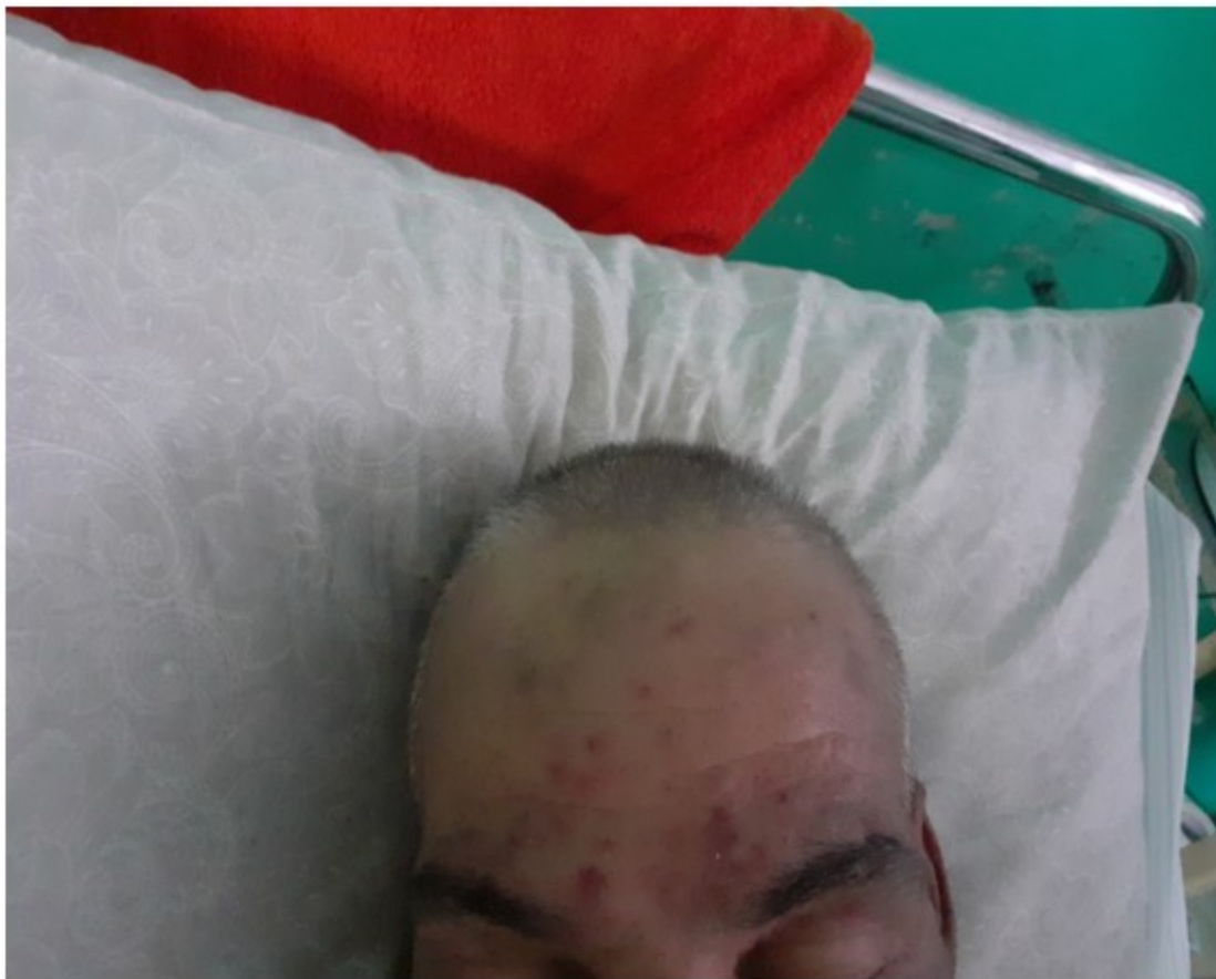
Fig. 1. Imagen que muestra el eritema en heliotropo y edema en párpados.

A la auscultación del aparato respiratorio, presencia de estertores crepitantes en base pulmonar derecha.