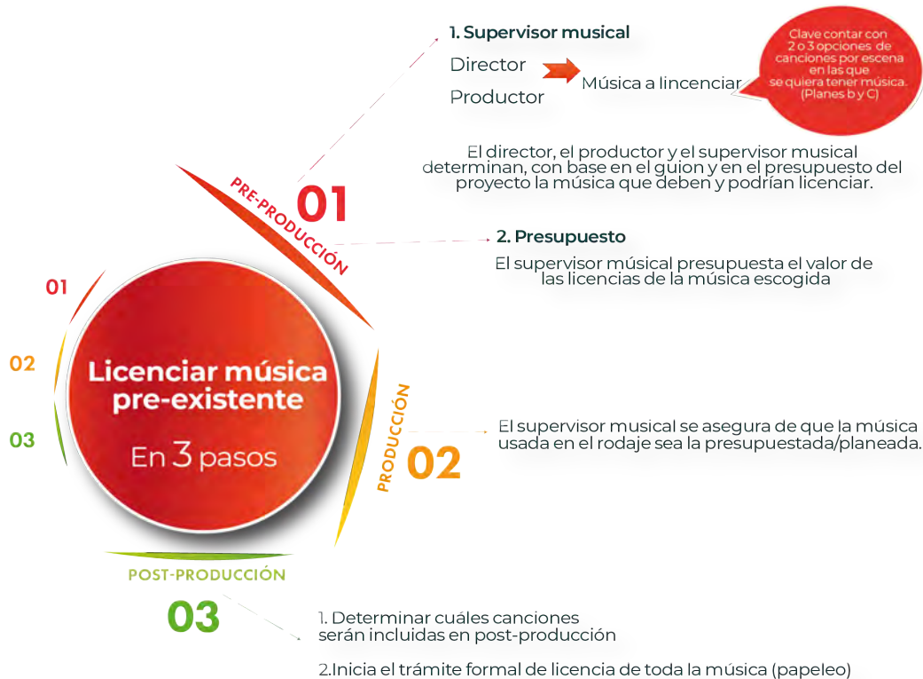
Ilustración 1: Licenciar Música pre existente. Diseño propio.