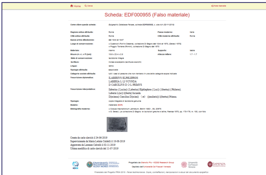
Figura 6. EDF (Epigraphic Database Falsae): la scheda

eventualmente incrociati tra loro e/o con voci relative ad indicazioni geografiche e/o cronologiche e/o al materiale, al tipo di supporto, alla classe epigrafica attribuita, possono permettere di individuare linee di tendenza nel gusto delle diverse epoche e a seconda dei luoghi (Fig. 6).