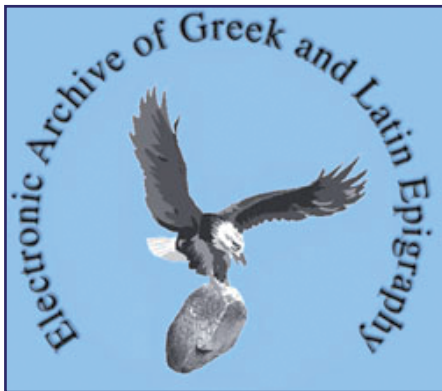
Figura 1. Logo della Federazione EAGLE (Electronic Archive of Greek and Latin Epigraphy)

Nel 2009, ai "membri fondatori" della Federazione è andata ad aggiungersi una nuova banca dati, Hispania Epigraphica Online (HEpO) 5 , che si occupa delle iscrizioni della penisola iberica. Scopo della federazione è essenzialmente quello di darsi dei criteri comuni, nell'ottica di una costante collaborazione internazionale, utili a coordinare l'opera di digitalizzazione del materiale epigrafico che ogni banca dati continua a perseguire autonomamente 6 . Tali criteri corrispondono non tanto a standard descrittivi internazionali,