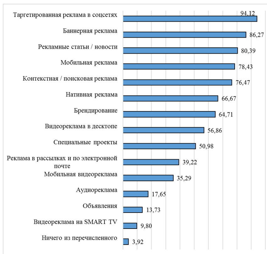
Рисунок 3. – Ответ на вопрос «Какие виды интернет-рекламы использует бренд, который Вы представляете?» (%) Источник: [2].

Результаты исследования указывают на широкий спектр используемых респондентами видов интернет-рекламы (рисунок 3). При этом для большинства брендов речь идет об одновременном применении нескольких ее видов.