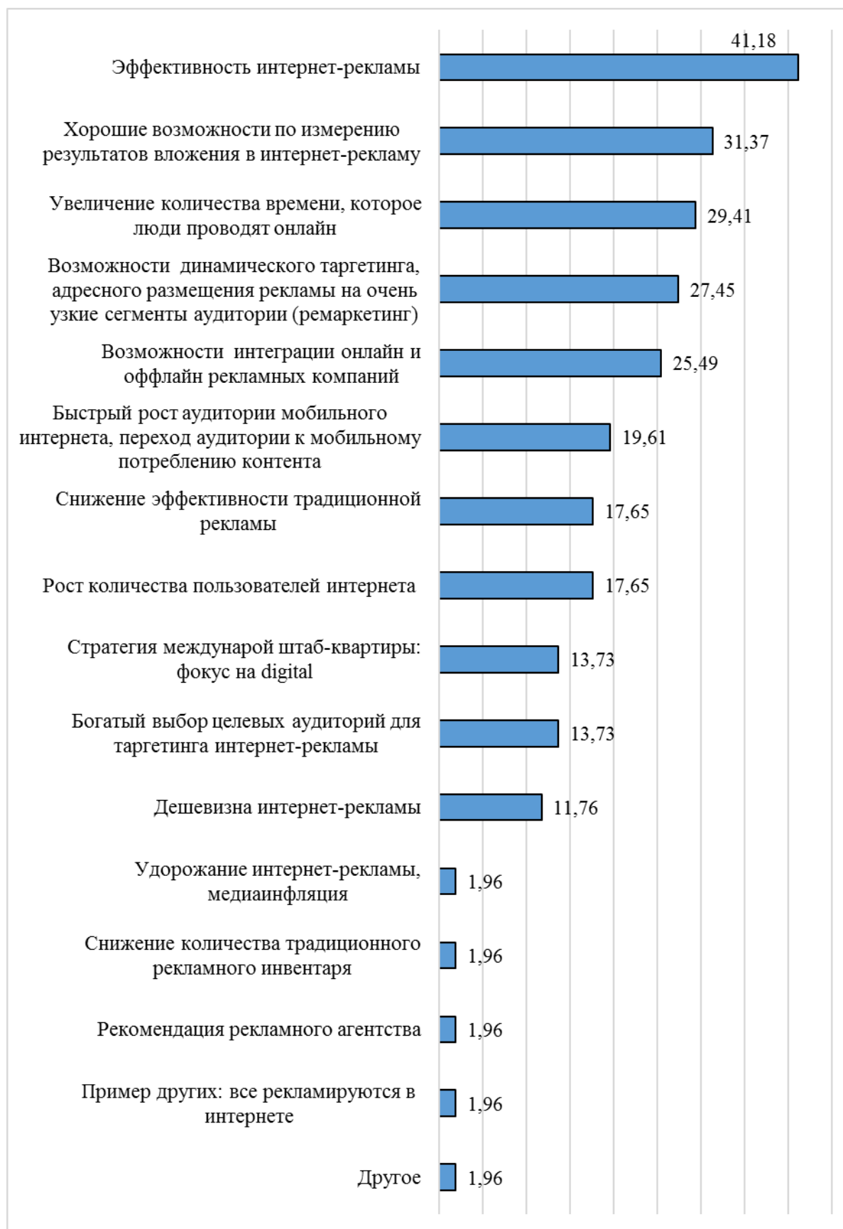
Рисунок 2. – Ответ на вопрос «Каковы, на Ваш взгляд, основные причины и драйверы увеличения доли интернет-рекламы в рекламном бюджете Вашего бренда?» (%)