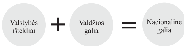
2 pav. Nacionalinės ir valdžios galių tarpusavio sąveika 62

Įsiterpiančių kintamųjų įtraukimas į galios skaičiavimus sudaro sąlygas atskirti potencialią ir faktinę valstybės galias, arba, kaip jas įvardija Zakaria – nacionalinę ir valdžios galias. Nacionalinė galia apima tradicinius materialius išteklius, identifikuotus klasikinių ir struktūrinių realistų, o valdžios galia įvardijama kaip vyriausybės gebėjimas išgauti nacionalinius išteklius, remiant vykdomą politiką, ir gebėjimas įgyvendinti keliamus tikslus. Vyriausybių galimybės iš visuomenės išgauti išteklius, kuriuos reikia panaudoti siekiant užsienio politikos tikslų, yra nevienodos. Valdžios galia apima „tą nacionalinės galios dalį, kurią vyriausybė gali išgauti savo tikslams ir [kuri] atspindi tai, kaip svarbiausi sprendimų priėmėjai gali lengvai pasiekti savo tikslus“ (žr. 2 pav.) 61 .