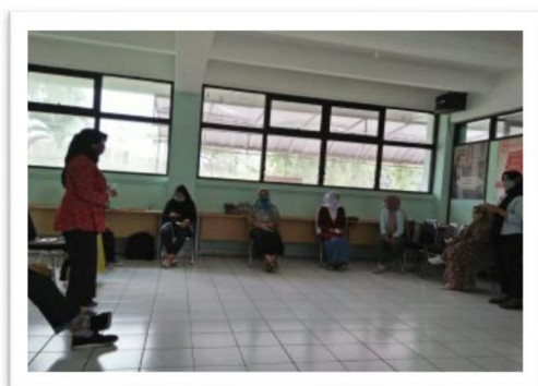
Gambar 1. Kegiatan Perkenalan Peserta

Permainan perkenalan ini efektif untuk membuat para peserta menjadi santai dan ceria ketika berkenalan dengan peserta lainnya.