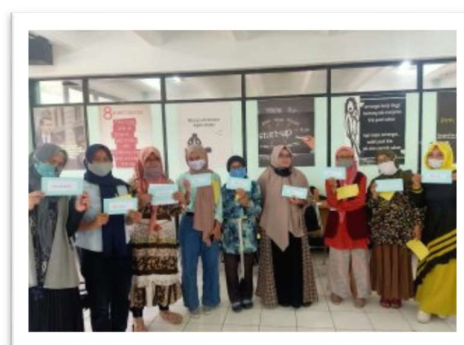
Gambar 5. Karakteristik Wirausaha

Untuk merefleksikan keyakinan para peserta pelatihan akan karakter mereka sebagai wirausaha, peserta diminta untuk menyebutkan karakter-karakter yang harusnya dimiliki oleh seorang wirausaha. Mereka memilih karakter dari sekian karakter yang sudah disediakan oleh instruktur seperti jujur, disiplin, kreatif dan inovatif, berkomitmen tinggi, mandiri dan realistis serta memiliki keterampilan personal.