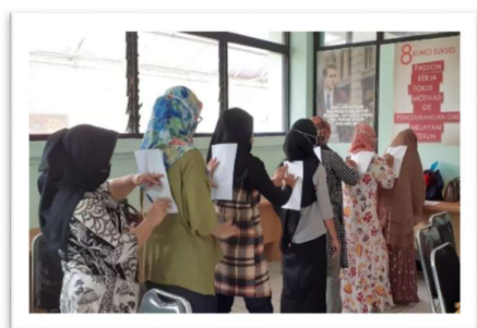
Gambar 3. Pesan Berantai Komunikasi Nonverbal

pesan. Peserta yang paling akhir menerima pesan menunjukkan hasil gambarnya.