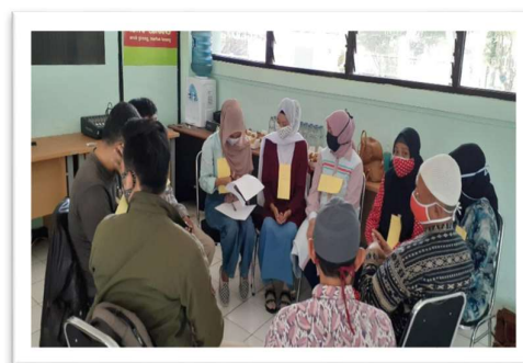
Gambar 4. Membangun Sinergitas Menciptakan Produk