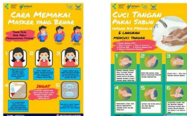
Gambar 2.1 Poster Edukasi Masker Gambar 2.2 Poster Edukasi Cuci Tangan

Kegiatan pemberian poster edukasi ini ditujukan kepada masyarakat terutama masyarakat di Desa Parungmulya untuk memberikan edukasi atau pengetahuan mengenai pentingnya menerapkan protokol kesehatan di tengah situasi wabah covid-19, juga membantu kepala desa dalam menyebarkan perintah untuk masyarakat agar sadar terhadap bahayanya penyebaran covid-19, bila masyarakatnya acuh dan tidak mendapat bimbingan mengenai edukasi protokol kesehatan.