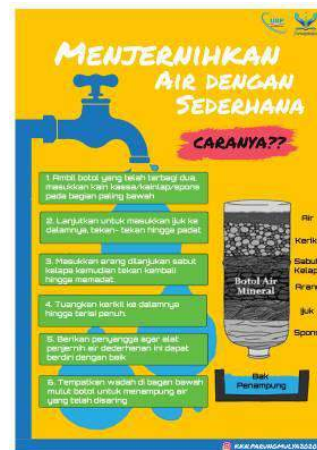
Gambar 2.5 Poster Edukasi Penjernihan Air