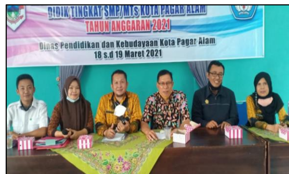
Gambar 4. Bersama Pegawai Dinas Pendidikan dan Kebudayaan kota Pagar Alam