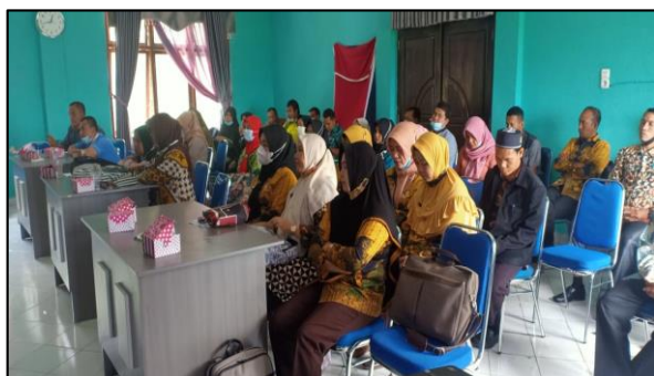
Gambar 3. Pelaksanaan workshop