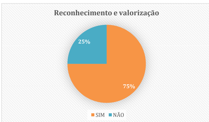
Gráfico 2: Reconhecimento e valorização

A partir do percentual negativo validado no Gráfico 2, embora na opinião de 70% muitos líderes façam a diferença, ainda existe uma fração expressiva que desvaloriza pessoas tão importantes e fundamentais, que movem e conduzem a jornada de uma organização.