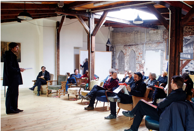
Abbildung 2 Werkstatt für gemeinsame Zukünfte

nes räumlichen Settings durch die Teilnehmenden (Böhme 2011: 243). Diese sollte sich absichtlich von den eher kalten und streng geordneten Konferenzräumen in den Behörden unterscheiden, wo die Kooperationsakteure üblicherweise die Zukunft des Gängeviertels verhandelten. Eine aufgelockerte Sitzanordnung aus unterschiedlichen Sesseln sollte außerdem dazu beitragen, dass sich die Teilnehmenden als individuelle Personen und nicht primär als Repräsentantinnen/Repräsentanten einer Institution adressiert fühlen. So sollte die Empathie der Teilnehmenden und ihr Bezug zum Gängeviertel gefördert werden, um unterschiedliche Wertvorstellungen, die sie daran knüpfen, während des Workshops produktiv verhandeln zu können. Darauf aufbauend sollten gemeinsame Ziele für die Zukunft des Gängeviertels gefunden und Handlungsblockaden zumindest teilweise gelöst werden, die eine Kompromissfindung im Konflikt um die Selbstverwaltung behinderten. Insgesamt beabsichtigte ich also mithilfe der künstlerischen Praktiken des Inszenierens und Arrangierens „ästhetische Erfahrungen“ (Bippus 2009: 12) unter den teilnehmenden Akteuren zu fördern, die eine zwischenmenschliche Annäherung und eine produktive Bezugnahme zum Gegenstand ihrer Kooperation unterstützen.