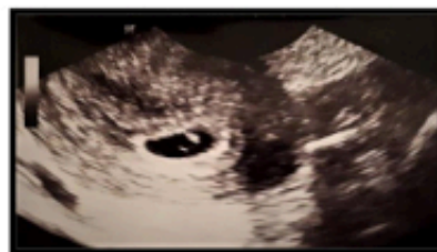
Ultraschall – 7. Schwangerschaftswoche

Die Vorteile sind zum einen, dass keine medizinischen Risiken für Mutter und Kind bestehen, da sie nicht in den Körper der Schwangeren eingreifen. Zum anderen werden die Untersuchungen überwiegend von der Krankenkasse übernommen.