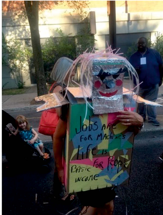
Abbildung 7: Grundeinkommenskostüm mit aufgezeichnetem Lächeln.