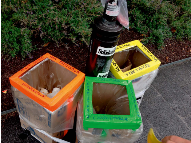
Abbildung 8: Mülltrennung auf der Attac Sommeruniversität 2014