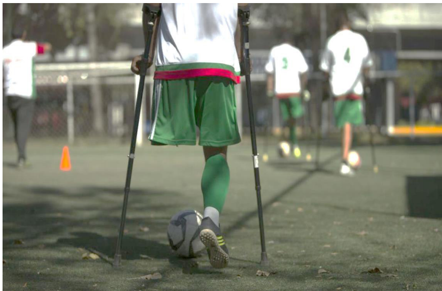
Figura 1 - Muleta Canadense

Em relação às demais regras, estas não diferem das utilizadas no futebol tradicional (ABDDF, [s.d.]).