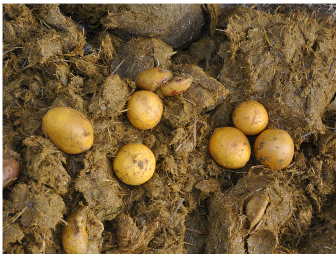
Fig.3. Bovino com timpanismo ruminal secundário. Conteúdo do rúmen com numerosos limões inteiros.