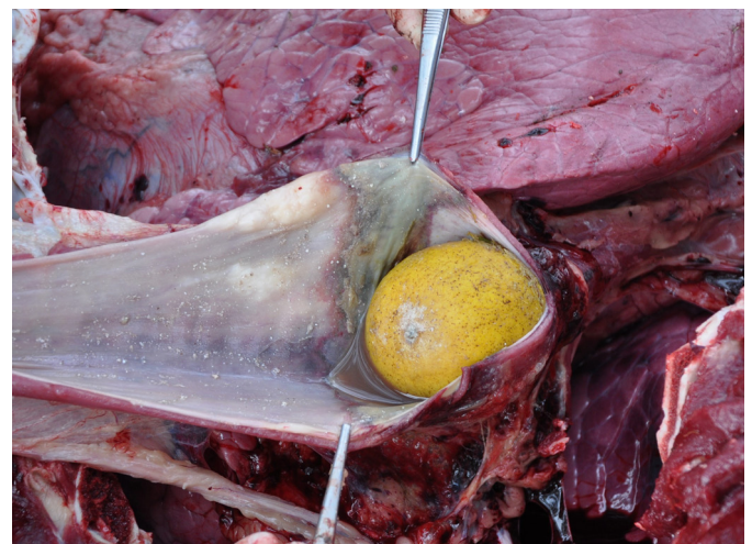
Fig.2. Bovino com timpanismo ruminal secundário. Obstrução total por limão siciliano na porção final do lúmen esofágico. Note também a área extensa de necrose na mucosa do esôfago no local da oclusão.