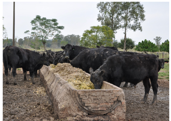
Fig.1. Bovinos alimentados com grande quantidade de resíduo de tangerina no cocho.

Cinco bovinos jovens, de um lote de 210, foram afetados por uma doença aguda fatal. Os casos ocorreram no mês de maio de 2015, em uma propriedade rural no município de Triunfo, Rio Grande do Sul, Brasil. Os bovinos desse lote estavam em campo nativo com boa oferta de gramíneas e há algum tempo eram suplementados com grande quantidade de resíduo de tangerina ( Citrus reticulata ) no cocho (Fig.1). Na última carga desse subproduto remetida para a propriedade, havia um grande número de limões sicilianos inteiros misturados acidentalmente ao resíduo. Os cinco