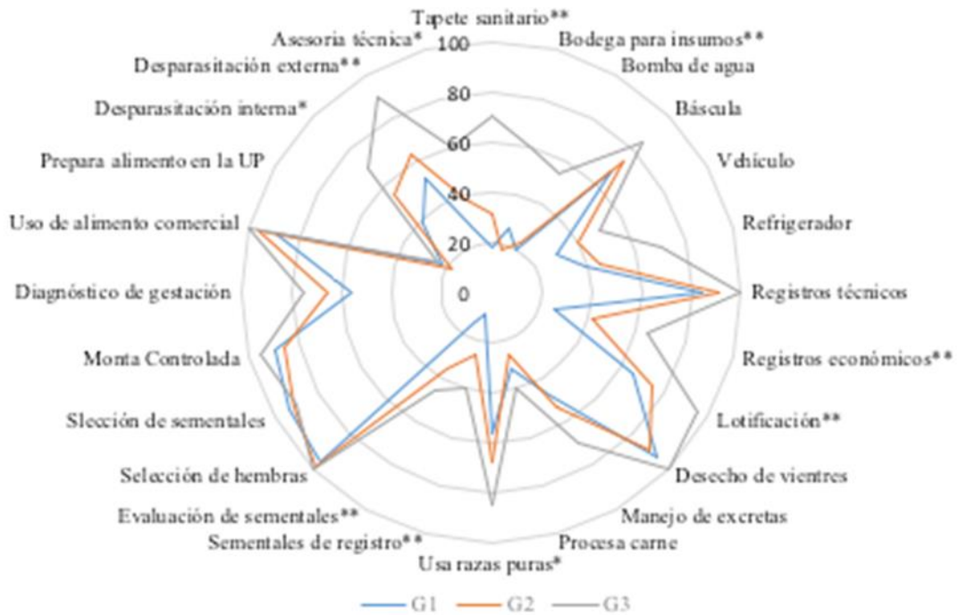
Figura 2: Uso de instalaciones, equipo y componentes tecnológicos por cunicultores de los estados del Centro de México

* Indica diferencia estadística Prob > Ji cuadrada 0.05.