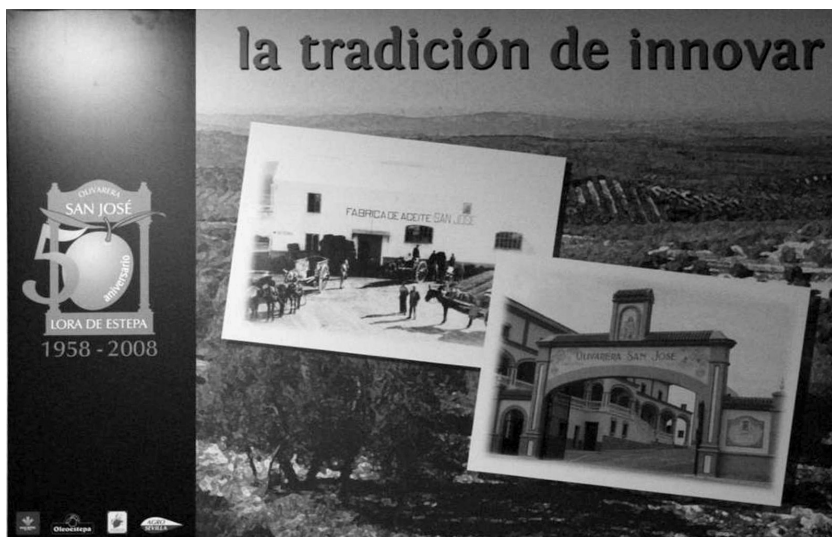
Foto 3. Cartel promocional ubicado en una cooperativa, DOP Estepa y Puente Genil (elaboración propia).

Esta dualidad se aprecia también en el discurso local sobre las marcas. Existe un fuerte arraigo, entre los olivareros, a la marca de cada una de las cooperativas, pues están vinculadas en el imaginario al autoconsumo y a un sentimiento de identidad local. Pero también se identifican con la nueva marca introducida por la Cooperativa de Segundo Grado, al ser la imagen del nuevo proyecto colectivo de producción de calidad en el territorio.