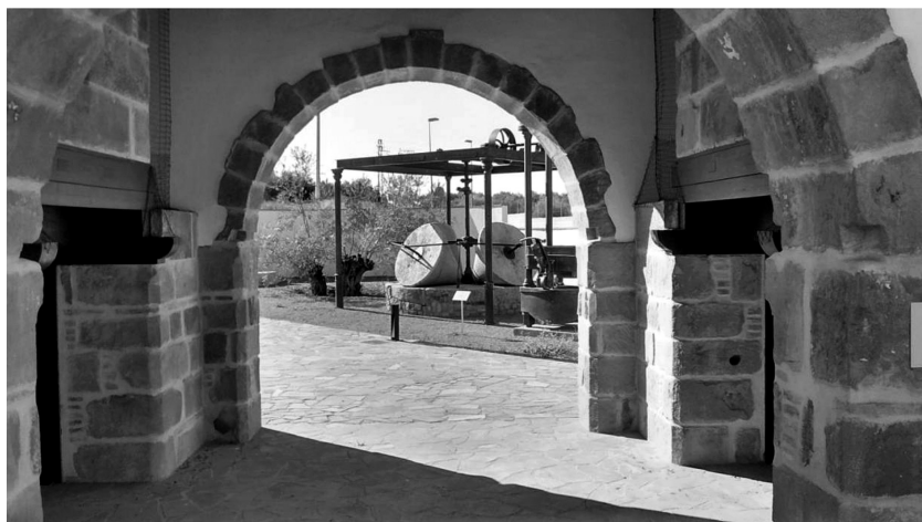
Foto 5. Instalaciones del «Centro del Olivar de Sierra» de Adamuz (elaboración propia).

Este modelo se caracteriza, como hemos mencionado, por un relato en el que la calidad se construye sobre las propiedades saludables de su variedad de aceituna, pero sobre todo en torno al valor del olivar tradicional de montaña, enfatizando su dimensión paisajística. Sin embargo, como en el segundo modelo, se hace referencia a la doble resistencia que debe afrontar este tipo de olivar respecto al intensivo. Se menciona la dificultad en la transformación de las prácticas agronómicas requeridas para producir calidad estandarizada en un olivar ubicado en extrema pendiente. En estas condiciones las fincas son difícilmente mecanizables y el desplazamiento diario a la almazara es complicado, lo que explica que en esta zona se mantengan prácticas agronómicas tradicionales.