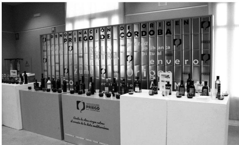
Foto 4. Muestra de la diversidad de marcas de aceites pertenecientes a la DOP Priego de Córdoba.

taria y como herramienta para luchar contra el fraude en la categorización de los aceites. Este relato de resistencia se extiende también a la creación de la entidad líder, ya que se narra que fue creada como estrategia colectiva ante la competencia insana interna propiciada por los corredores de aceite. Así mismo, la estrategia de calidad se percibe como una alternativa para trascender las desigualdades en la cadena del valor del aceite.