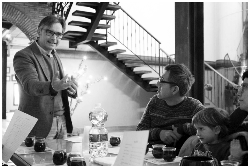
Foto 2. Cata de aceites para turistas. DOP Priego de Córdoba (elaboración propia).

tema, se trata de transmitir ese sentimiento, ese conocimiento. Es que la gente no sabe, que la gente aprenda» (experto catador y agricultor, Priego de Córdoba).