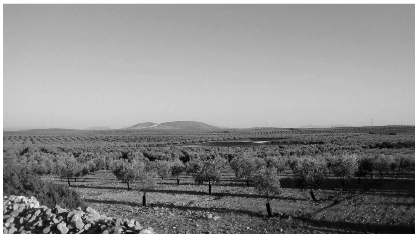
Foto 1. Olivares de nueva plantación. DOP Estepa y Puente Genil.

El segundo modelo es el denominado «Calidad Territorial», representado por la comarca de Priego de Córdoba. En este modelo coexisten múltiples entidades: almazaras privadas, cooperativas, envasadoras y comercializadoras, así como diversidad de políticas de calidad, de estrategias de comercialización y de marcas comerciales. La entidad que lideró el proceso de conversión a la producción de calidad fue la DOP Priego de Córdoba, ya que es la que representa y en la que convergen la diversidad de iniciativas del territorio. La DOP fue creada el año 1995 a iniciativa del propio sector, con liderazgo tanto del sector cooperativo como del privado. Entre las 24 entidades vinculadas al sector del aceite que forman parte de la DOP hay una asociación de cooperativas de primer grado unidas para la comercialización, cuatro cooperativas (de las cuales una está inscrita también como envasadora y comercializadora), seis almazaras privadas (dos de las cuales están inscritas también como envasadoras y comercializadoras), así como cuatro envasadoras y comercializadoras. Esta entidad aglutina a la mayor parte del sector (79% de los operadores), ya que únicamente cinco entidades no forman parte de la DOP (dos almazaras cooperativas y tres iniciativas privadas).