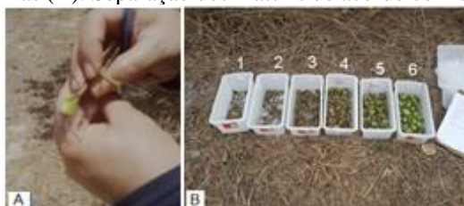
Figura 3. Medição das castanhas (A). Separação dos maturis de acordo com seus respectivos tamanho (B).

Com a estimativa preliminar dos tamanhos das castanhas (Tabela 2), deu-se o início aos experimentos no campo experimental. A coleta dos maturis obedeceu a um caminhamento em ziguezague (BLEICHER et al. 1993; MESQUITA et al, 2004). As plantas foram selecionadas ao acaso e a área de cada campo/pomar foi percorrida em toda a sua extensão. Após a coleta dos maturis e suas castanhas foram medidas individualmente, no sentido longitudinal, com auxílio de uma régua (Figura 3A). No total, 600 unidades de maturis foram coletadas em duas épocas nos dois campos e selecionados conforme as medidas preliminares descritas na tabela 2. Após seleção, os maturis foram acondicionados em caixas plásticas (Figura 3B) e transportados para o Laboratório de Entomologia. Todo esse processo foi realizado em duas épocas de coleta (Tabela 3).