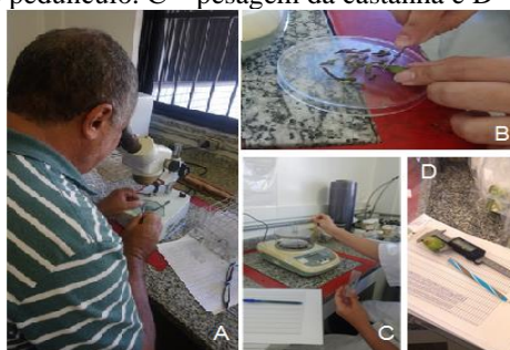
Figura 4. A – Avaliação da presença de ovos de traça-das-castanhas nas castanhas e pelo furo de entrada da larva, recém-eclodida, na castanha. B – retirada do pedúnculo. C – pesagem da castanha e D – medição da castanha.