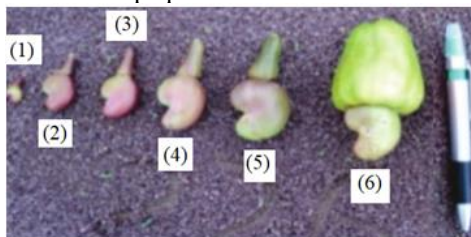
Figura 1. Fases de maturação da castanha desde o pequeno maturi até a castanha verde no seu desenvolvimento máximo.