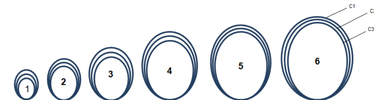
Figura 5. Escala de tamanhos de castanhas confeccionada e impressa no tamanho real. Tamanho 1 (T1) ao tamanho 6 (T6). A circunferência C2 = média e C1 e C3 = média ± Desvio Padrão.

C1, C2 e C3 – circunferências; L – largura; C – comprimento.