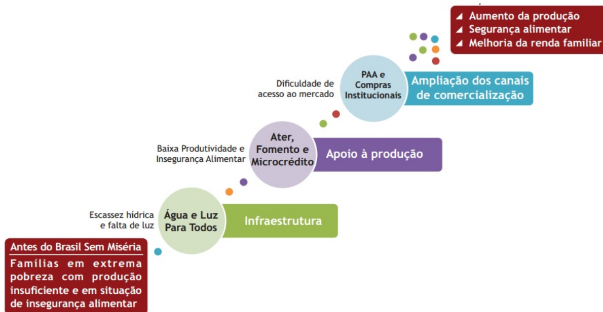
Figura 3 – Rota da inclusão produtiva rural no PBSM