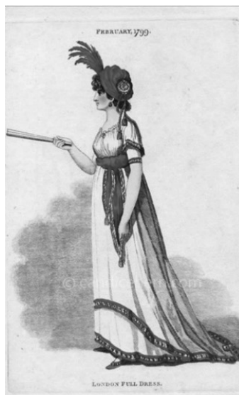
Slika 14: Ženska haljina iz perioda Direktorata sa grčkom ukrasnom trakom i turbanom u turskom stilu