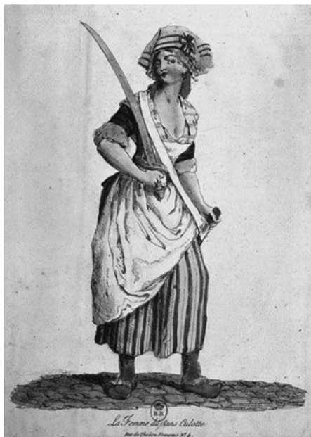
Slika 3: Republikanka u vreme Francuske revolucije