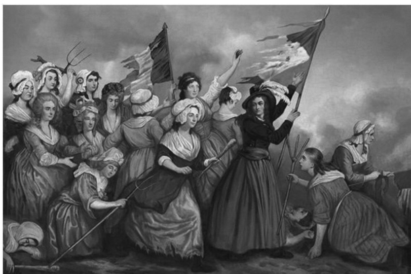
Slika 9: Žene revolucionarke tokom Francuske buržoaske revolucije.