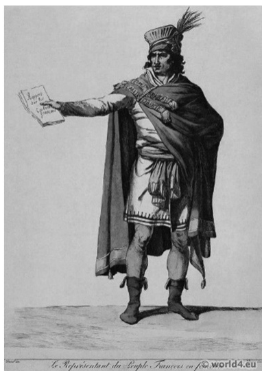
Slika 8: Moda u vreme Francuske revolucije

Kireeva [3] naglašava: „Često je previše ekstravagantni oblik određen složenošću događaja tokom ovog istorijskog perioda“. Vrlo zanimljivo zapažanje o raznolikosti mode daje Pjužo (Пюжо), koji u svojoj knjizi „Pariz u osamnaestom veku“ piše da kada je jedne iste večeri morao da poseti salon jedne plemenite dame i u tom salonu su bile tri druge žene, one su morale da budu različito obučene - prva u „grčki“, druga u „turski“, a treća u „engleski“ kostim“ [4]. Činjenica da politika, kao umetnost kompromisa, počinje da utiče na modu takođe je veoma važna za ovu studiju. Budući da formira razmišljanje i ponašanje čoveka u sokratovskom smislu „bića koje ima društveni život“, takođe daje direktne refleksije na demonstraciju njegovih stavova. Društveni razlozi u izboru i nošenju odeće imaju prednost nad ostalim razmatranjima. Tokom godina revo-