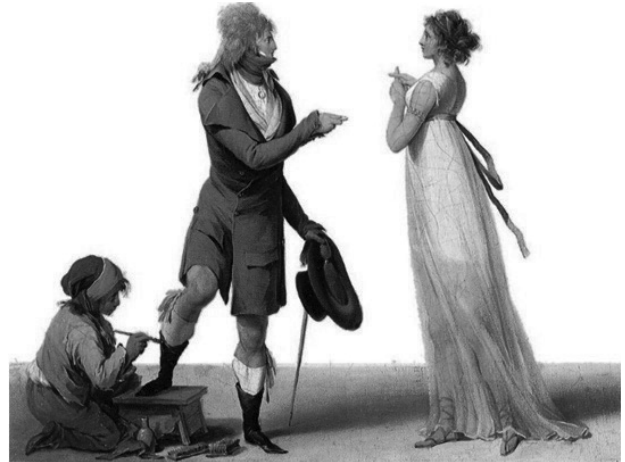
Slika 28: Mesto konvencije. Luj Leopold Boili, 1797. „Incroyables“ i „Merveilleuses“

Ženska moda Mervejeza, kao pandan Enkroajblima, bila je konstituisana prema istim „modnim principima“. Može se reći da je njihov kostim pratio trendove ženske mode iz vremena Direktorijuma, samo što je bila ekstravagantnija, teatralnija i smelija u naglašavanju golotinje ženskog tela (vidi Slike 27 i 28). Njihova pojava sledi iste principe i demonstrira istu političku pristrasnost i finansijski prosperitet, ali nje-