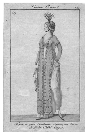
Slika 18: Damski kostim sa elementima sa Dalekog Istoka, 1797 godina https://www.pinterest.com/pin/7951736818887684/