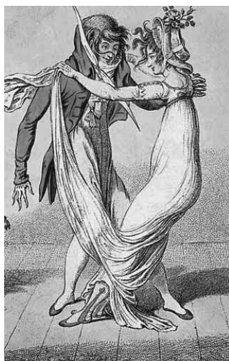
Slika 21: „Incroyables“ i „Merveilleuses“