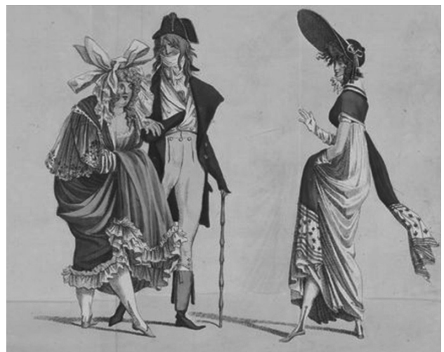
Slika 29: „Incroyables“ i „Merveilleuses“ iz 1797.

na osnova je, za razliku od muške mode, ampir haljina stvorena prema klasičnoj liniji antičke Grčke. Haljinu visokog struka načinjenu od prozirnih tkanina nosila je i jedna od dama, Madame Talen. Kako haljine nisu imale džepove, potreba za nošenjem svih neophodnih stvari rešena je pojavom već pomenute ženske torbice „reticule“ (ili „ridiculé“- u prevodu znači smešno). Izgled je upotpunjen i obućom; na nogama nose cipele sa visokim potpeticama, dok su kosu oblikovale po uzoru na stare Rimljane - Tita, Bruta, Karakalu. Takođe je bilo dozvoljeno nošenje perika preko kojih se stavljao šešir sa ogromnim obodom. Našivanje traka različitih boja, kao i nošenje ogromnih ešarpi, takođe su bili obavezni modni elementi Mervejeza (Slika 29).