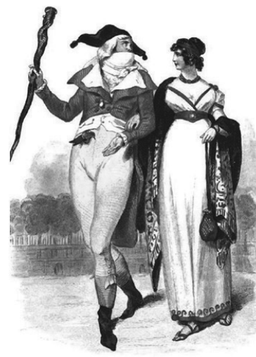
Slika 22: „Incroyables“ i „Merveilleuses“