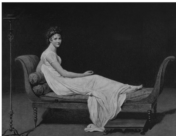
Slika 12: Originalni naslov: Portrait of Madame Récamier by Jacques-Louis David (1800)