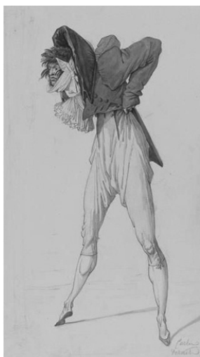
Slika 20: „Incroyables“

Kao što se usled groznice bolesnik pokriva brojnim pokrivačima i pod njima drhti, tako i Enkroajabl poput „bolesnika“ navlači tri prsluka, raznobojna, jedan preko drugog. Njegova prvobitna politička „kratkovidost“ manifestovala se u optičkim instrumentima