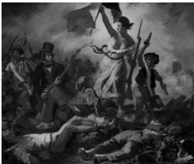
Slika 1: La Liberté guidant le peuple – par Eugène Delacroix (1830). Sloboda vodi narod – autor Ežen Delacroix (Eugène Delacroix) (1830).

Mnogi analitičari istorije mode primećuju veliki značaj Francuske buržoaske revolucije za razvoj evropske mode. Može se reći da se tu nalazi koren savremenih modnih trendova. Od trenutka kada je buržoazija u Francuskoj odbacila monarhiju i dala masama dugo očekivanu slobodu i slogan „ Liberté, égalité, fraternité “ („Sloboda, jednakost, bratstvo“, Slika 1), moda postaje značajno političko oružje i otvorena politička demonstracija poput štampe, javnih i političkih debata.