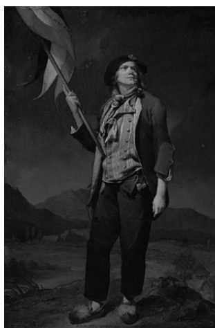
Slika 10: Obitelj revolucionar obučen u sankilote (sans-culottes), umetnik, Luj Leopold Boili (Louis-Leopold Boilli) (1761-1845).

ciju” u Francuskoj. Sastojao se od pet direktora, zbog čega i vlada i stil dobijaju to ime. Glavna karakteristika koju uočavaju svi analitičari Direktorijuma bila je tendencija „povratka antici”. Kraj „terorističkog režima” traži stvaranje atmosfere u kojoj se na njega zaboravlja i žudi za životnom strašću. U društvu skorojevića iz perioda Direktorijuma, žene pronalaze nove mogućnosti; modni časopisi se ponovo pojavljuju, pa tako i odmarališta, kao mesta uživanja, ponovo počinju da funkcionišu. Vreme direktorijuma odnosi se na neoklasične stilove u dekorativnoj umetnosti i modi koji karakterišu taj period. Glavni trend koji se manifestuje u ovoj atmosferi reakcije je „strast prema antici” (odeća iz perioda antike), koja počinje u određenim krugovima, ali ubrzo postaje univerzalna. Ovaj trend je postao univerzalni stil i počeo je da obuhvata i umetnost i slikarstvo, kao i književnost, pozorište, muziku i poslednje, ali ne najmanje važno - kostim. Društvo proširuje svoje sklonosti ka „nebesko beloj boji”, koja počinje sve sigurnije da istiskuje „tamu” iz perioda revolucije. Dolazi vreme „zemaljskih boginja” (kako zovu tadašnje dame). Iako muškarci lično ne shvataju ovu modu, to ne znači da ne uživaju u „nezemaljskoj lepoti” svojih dama. One postaju njihove zavodnice, muze, heroine, statue kojima se klanjaju (vidi Sliku 12).