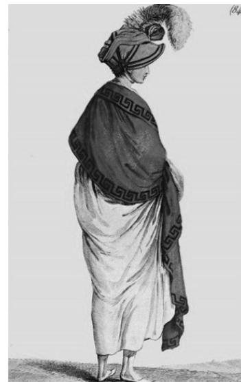
Slika 15: Crveni šal sa grčkim ključnim obrubom, u kontrastu sa belom haljinom u stil Direktorijuma, iz žurnala Costume Parisien, 1799.

Portret Madam Rekamie je portret pariske svet-ske dame Džuliet Rekamie iz 1800. godine umetnika Žak-Luja Davida, koj je prikazuje u toaleti neoklasične mode, naslonjenu na sofu iz perioda Direktorijuma u jednostavnoj haljini ampir linije (visok struk - iznad prirodne linije struka) sa kratkim „bubi“ rukavima i kratkom kosom „a la Titus“.