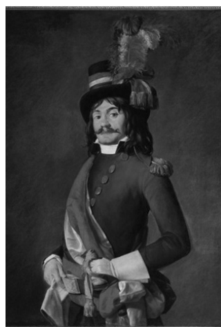
Slika 11: Portret Žan-Batista Mijoa (Jean-Baptiste Milhaud), Zamenika konvencije, u uniformi komandanta vojske, umetnik Žak-Luj David (1794)