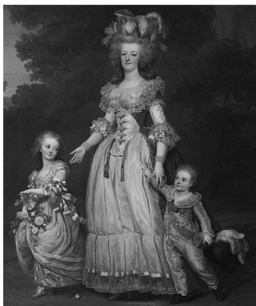
Slika 7: Portret Marije Antoanete koja se, zbog svog ekstravagantnog životnog stila (i odeće), smatra glavnim razlogom za početak F.B.R.