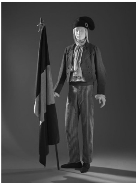
Slika 4: Kostim francuskog revolucionara poreklom iz običnog proleterskog naroda

[Izvor: https://www.pinterest.com/pin/331366485061513930/ - datum posete: 09.02.2021]