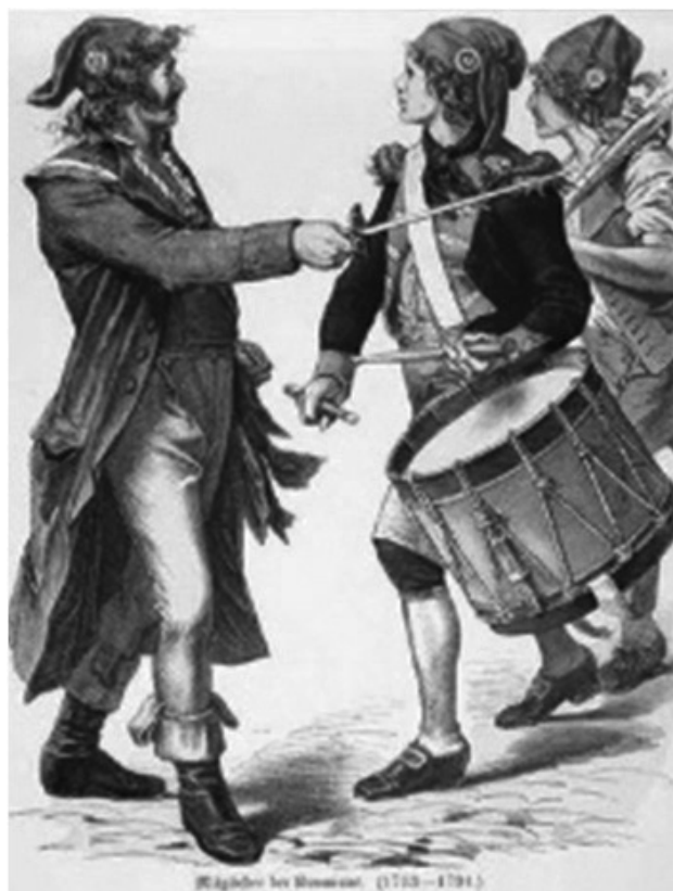
Slika 2: Revolucionari iz doba Francuske buržoaske revolucije. (levo) Sankiloti (sans-culottes, oni bez kilota sl. levo, i vrsta čakšira do kolena nošene sa čarapama, desno)

Usled turbulentnih dešavanja društvo ne samo da menja svoj kalendar, ritam i način života, već se oslobađa klasnih i socijalnih privilegija i vekovnih predrasuda (vidi Sliku 2). E. Arabadžieva [1] primećuje da su događaji koji su zahvatili Francusku tokom ovih 5 godina (1794-1798) promenili sve privilegije i običaje, a „ ideje koje su inspirisale francuski narod uticale su i na kostim “. Međutim, kako bi se pratio nastanak i razvoj prve subkulture u istoriji mode, sa procesom razvoja neophodno je istovremeno pratiti i razvoj modnih trendova.