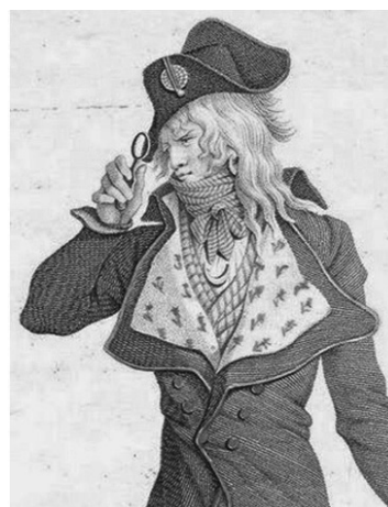
Slika 24: „Incroyables“