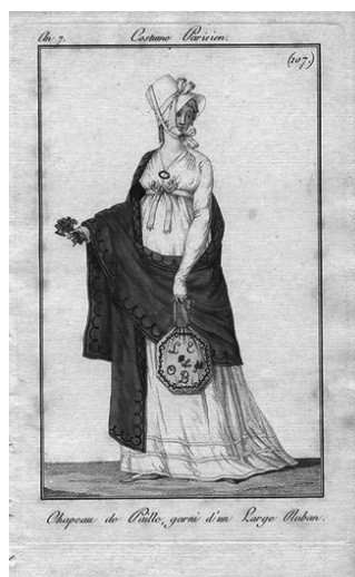
Slika 16: Damski kostim iz perioda Direktorijuma

Ukus beskrajnoj novosti se vraća u društvo. Odeća proletarijata, koja se pojavila na početku revolucije, sada je određenija i ukazuje na svoje nosioce. Protivnici revolucije, s druge strane, nosili su crne kostime „demi convert“ („polu-transformisan“- francuski) i čak su svoju posebnost demonstrirali specijalnim „crnim kragnama“ za rojaliste, opirući se „crvenim kragnama“ koje su nosili republikanci.