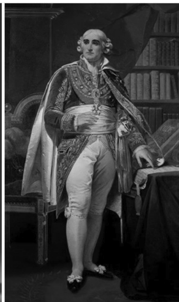
Slika 5: Kostim aristokrate tokom Francuske buržoaske revolucije