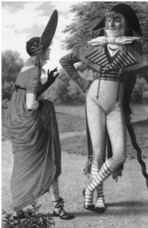
Slika 26: „Incroyables” i „Merveilleuses”

Protivi se i zabrani nošenja određenih boja, tako da nosi plavi frak na kome je prišivena ogromna zelena kragna, jer je ovo boja grofa d'Artoa, mlađeg kraljevog brata (vidi Slike 23 i 24). Na neočekivanim mestima na odelu prišiva crne trake kao znak žalosti, ili na frak prišiva sedam ogromnih sedefnih dugmadi, čiji broj aludira na starost maloletnog zatvorenika u Hramu („Le Temple” – kraljevski zatvor). Komisarževski [10] daje sledeći njihove pojave: „Nazivani su Enkroajabli” (neverovatni) jer nose kape sa visokim tilom i neobično zakrivljenim obodom, šetaju ulicama odeveni u ekstravagantanu odeću gotovo karikaturalnu, poput jarko žutih „culottes” (muške pantalone) dužine malo ispod kolena, belog fraka sa jarko zelenim okovratnikom i vatreno crvenim prslukom, na nogama su čizme sa širokim sarama, koje se asimetrično preklapaju tako da se vide čarape, takođe obojene jarkim bojama ili sa cvetnim dezenom” (vidi Sliku 26).