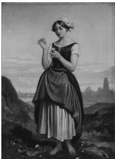
Slika 6: Portret siromašne seljanke iz doba Francuske buržoaske revolucije