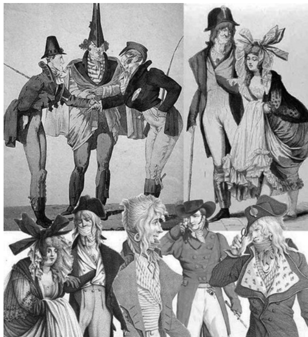
Slika 19. „ Incroyables “ i „ Merveilleuses “