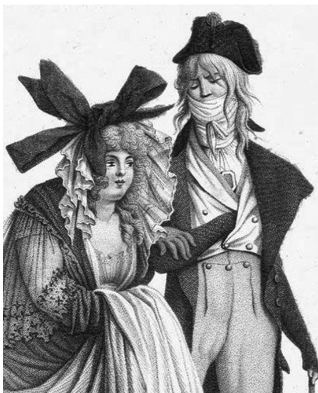
Slika 25: „Incroyables” i „Merveilleuses”