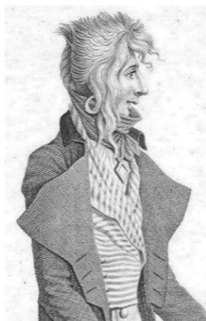
Slika 23: „Incroyables“