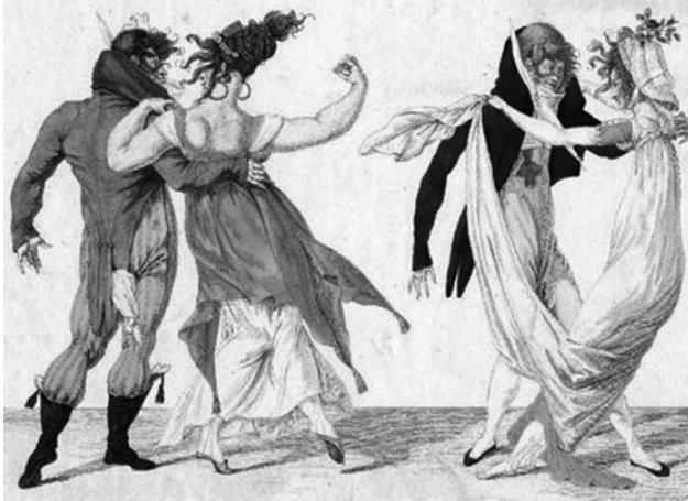
Slika 27: „Incroyables“ i „Merveilleuses“