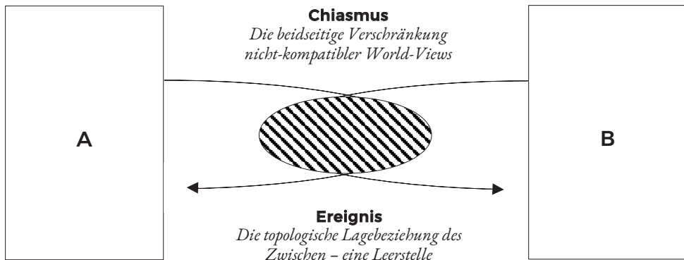
Abbildung 2 Chiasmus – eine wechselseitige Verschränkung nichtkompatibler Komplemente

im bisherigen Argumentationsgang die relationstheoretischen Sichtweisen in Hinblick auf den strukturellen Hintergrund zunehmend erweitert und ihm damit wachsende Tiefenschärfe verliehen. Ausgehend von einem substantiell auf den Punkt gebrachten Inhalt erweiterte sich die Optik über den Fokus auf konstitutive Grenzlinien zum differenten Gegen-Stand hin zur grundlegend ausgespannten Feldstruktur, um dort die Konfigurationen pädagogisch machtvoller Disziplinarordnungen institutionstheoretisch informiert in den Blick nehmen zu können. All diese Blickweisen auf Bildung bewegten sich in ihren Ausdifferenzierungen von Knoten und Linien zunehmend komplexer Netzwerke dimensional auf der Fläche. Mit der nun aus dem optischen Instrumentarium gegriffenen fünften Linse wird der