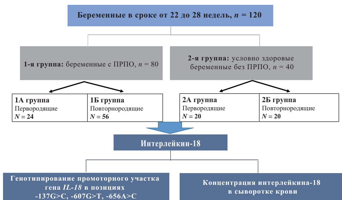
Рис. 1. Дизайн исследования. Fig. 1. Experimental design.

В исследование «случай-контроль» были включены 120 беременных женщин в сроке гестации 22–27 недель 6 дней. Исследование проведено на базе государственного бюджетного учреждения Ростовской области «Перинатальный центр» (ГБУ РО «ПЦ»). Исследуемые 120 беременных были разделены на две группы: основная группа состояла из 80 беременных с преждевременным разрывом плодных оболочек в сроке