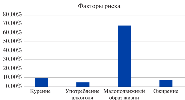
Рис. 1. Распространенность традиционных ФР (n=82).

За рефересные значения для уровня липидного спектра использовались следующие цифры: <5,0 ммоль/л для общего холестерина (ОХС), <3,5 ммоль/л для липопротеинов низкой плотности (ЛНП) и <1,7 ммоль/л для триглицеридов (ТГ). Для мужчин уровень липопротеинов высокой плотности (ЛВП) считался низким при цифрах <1,2 ммоль/л, а для женщин — 1,0 ммоль/л [5].