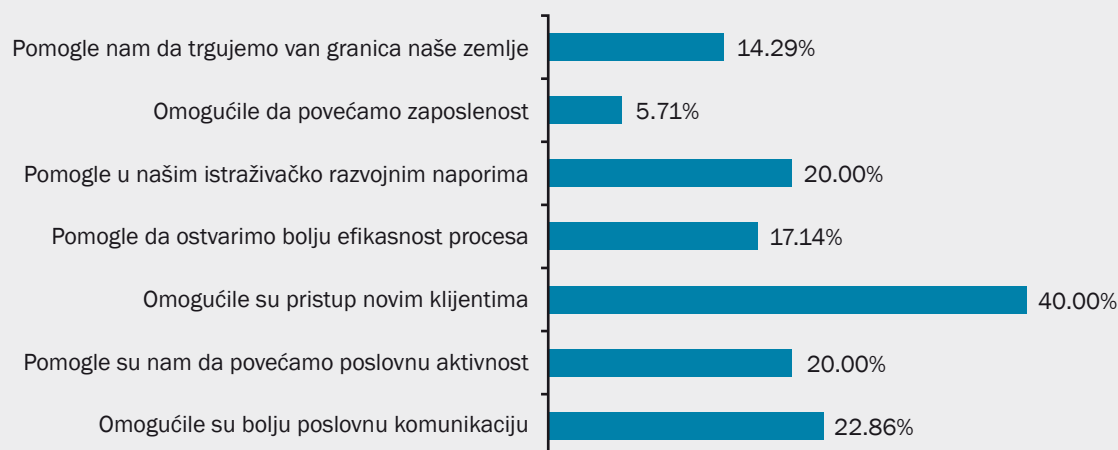
SLIKA 2. Stepen satisfakcije klijenata uslugama EEN-a u periodu 2009-2011.