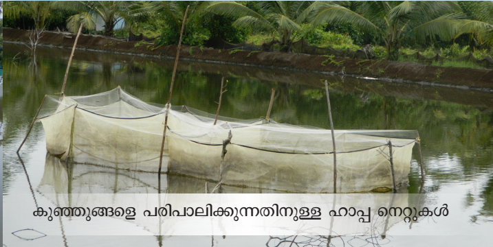
കുഞ്ഞുങ്ങളെ പരിപാലിക്കുന്നതിനുള്ള ഹാപ്പി നെറ്റുകൾ