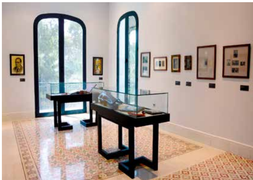
Sala dedicada a Telmo Vela en la exposición permanente de la Casa Parque de Crevillente