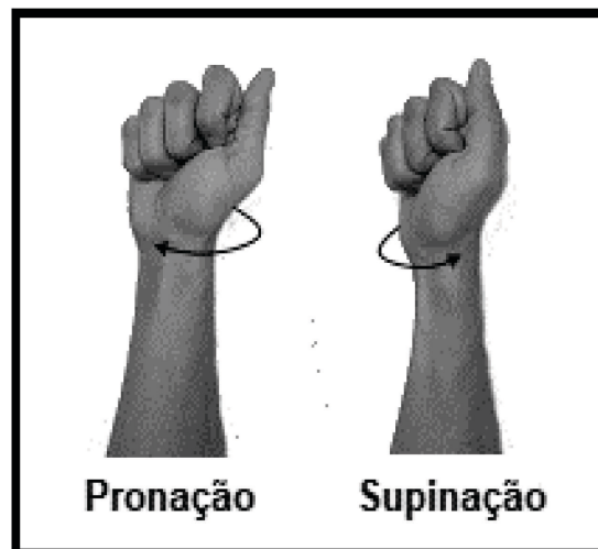
Figura 3: Mudança de Orientação

- Supinação : giro do pulso e do antebraço no sentido em que se a palma da mão estiver virada para baixo, a orientação dela é alterada em sentido horário para cima. Dos sinais analisados, 134 apresentam supinação em sua articulação. Para melhor entendimento, vejamos a imagem a seguir: