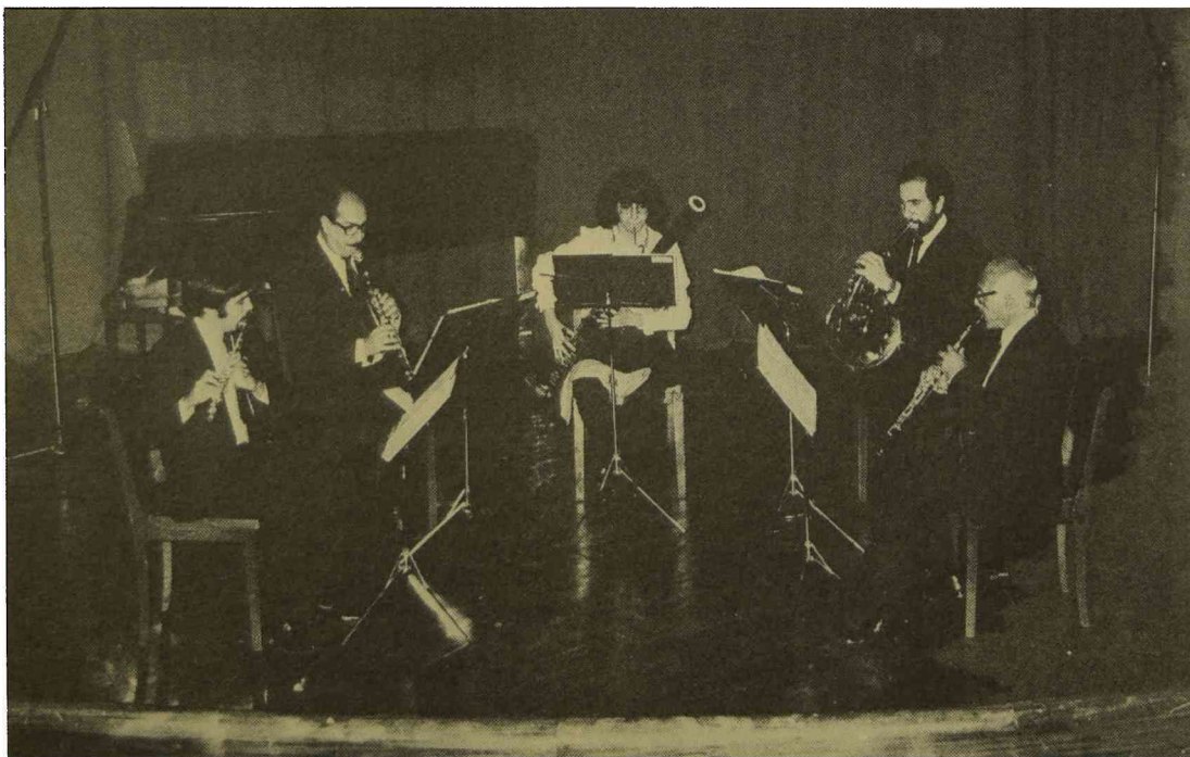
Actuación del Quinteto de Vientos de Radic Universidad Nacional de La Plata. Abril de 1982.