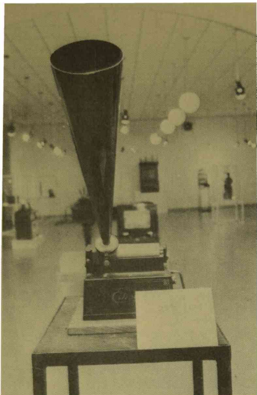
Exposición de la "Colección Azzarini" realizada en Quilmes. Marzo de 1982.