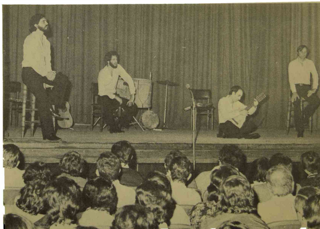
Actuación del Cuarteto Zupay. Julio de 1981.