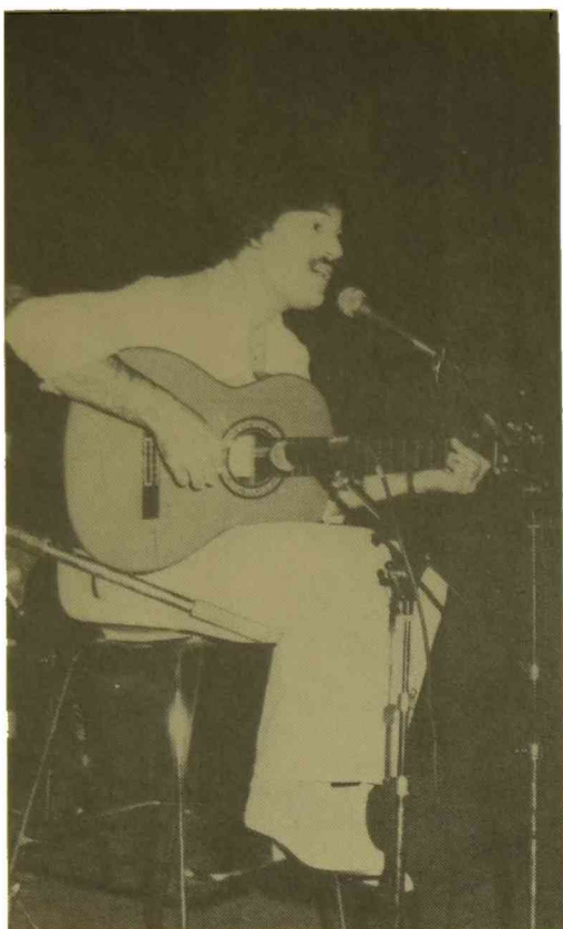
Actuación de Toquinho, abril de 1981 y su cuarteto brasileño.