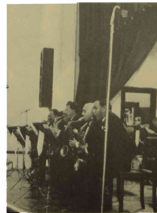
Presentación de la Swing Serenader's Band. Octubre de 1981.