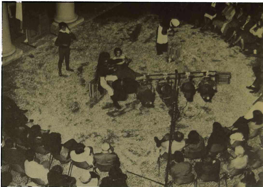
Ciclo de teatro para niños, a cargo de la Agrupación para el Teatro Rioplatense. Abril de 1982.