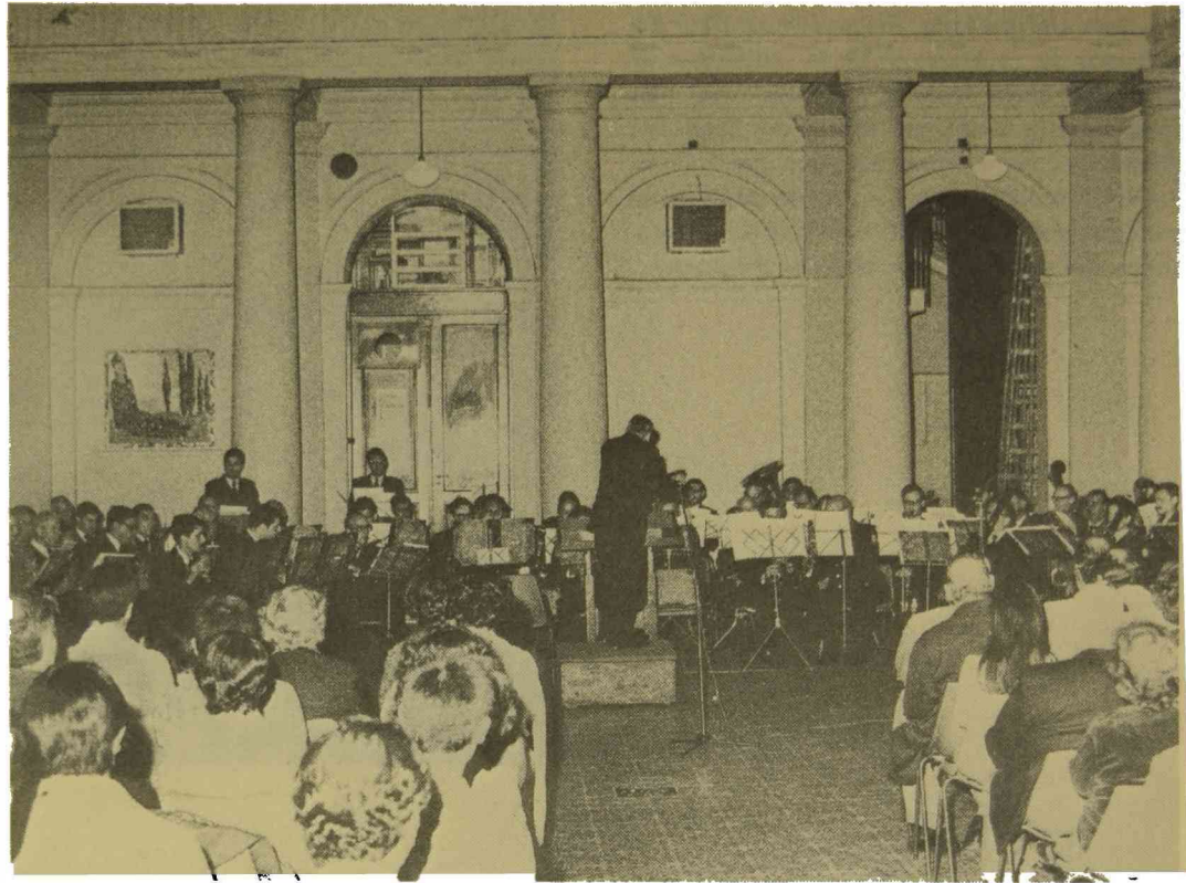
Concierto de la Banda de Policía en el patio del Rectorado. Abril de 1982.