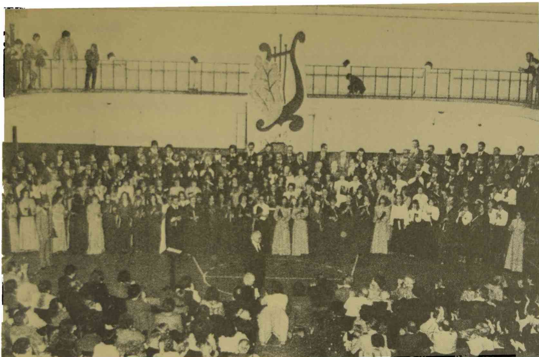
Actuación del cuarteto de cuerdas de la Universidad: en la Facultad de Ciencias Médicas, agosto de 1982.