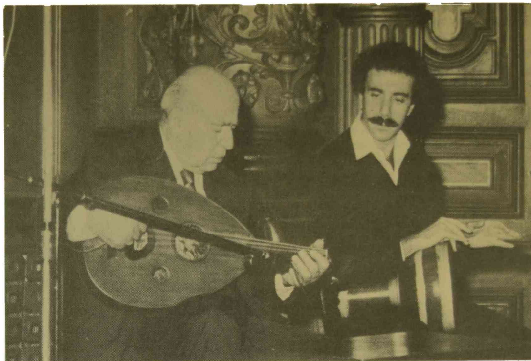
Concierto de 'ud y darabuka. Mayo de 1981.