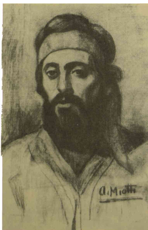
Carbonilla perteneciente a la exposición realizada por el pintor Armando Miotti en el Colegio de Escribanos.