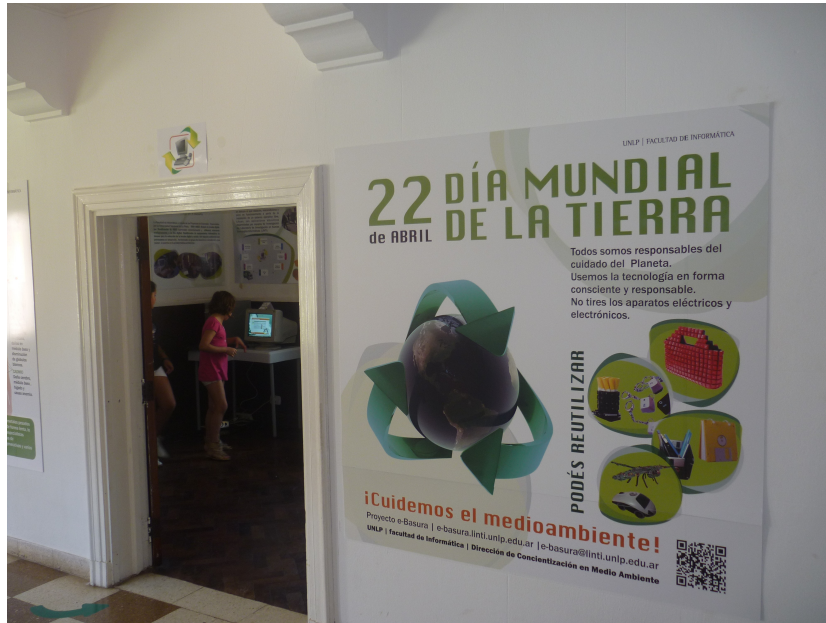
Figura 3: Feria de Tecnología TEC La Plata