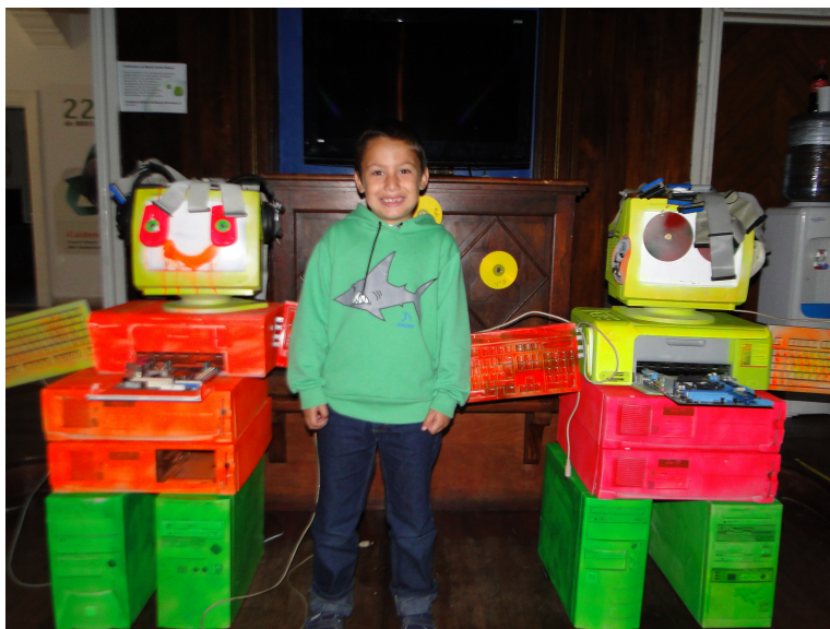
Figura 5: Muestra realizada en la Feria de Tecnología TEC La Plata 2012

La experiencia demuestra que la chatarra electrónica puede utilizarse no sólo para el reacondicionamiento operativo de la misma sino para diversos usos que abarcan desde la utilización de partes para pruebas de robotización hasta el arte chatarra, como se muestra en la Figura 5.