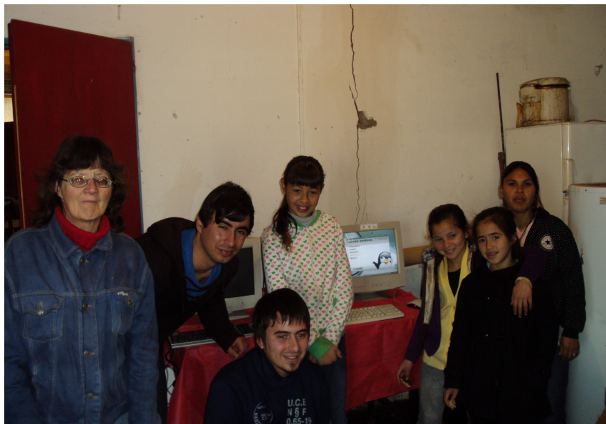
Figura 2 : Donación al Comedor Tricolor

Cabe mencionar, dentro del ciclo de trabajo de un proyecto de similares características, que la primer cuestión que debe resolverse es verificar la existencia de una empresa que realice la disposición final segura y que cuente con la habilitaciones pertinentes a nivel Nación y/o Provincia. Este fue el primer punto que se resolvió al encarar la iniciativa, para lo cual se firmó convenios con empresas de disposición final.