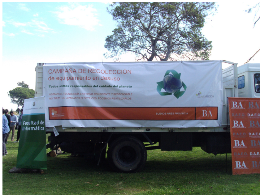
Figura 4: Tercer Campaña de Recolección de Equipamiento Informático en desuso