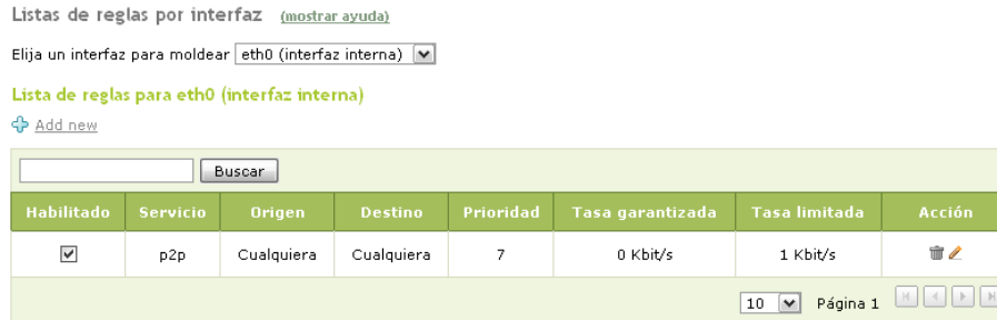
Fig. 5 – Vista del Módulo Modelado de tráfico.

Ares, etc.) tenga un mínimo de ancho de banda. En la Fig. 5. Se puede ver que las reglas de filtrado p2p están activadas.