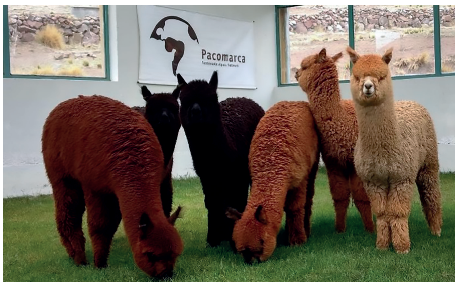
Figura 1. Fenotipos de alpacas Huacaya de color observados y registrados en Pacamarca.

Las muestras de fibra fueron lavadas antes de su medición. El equipo Chroma Meter CR-210 (Konica Minolta) se calibró con un patrón estándar según las especificaciones del manual, siguiendo el procedimiento CIE L*a*b* (CIE 2004) y posteriormente se realizaron las mediciones de L^* , a^* , b^* en 14 vicuñas y 79 alpacas Huacaya. L^* = luminosidad, a^* = [saturación de color rojo (+) al verde (-)] y b^* = [saturación de color amarillo (+) al azul (-)]. Adicionalmente se calculó la intensidad = [(a^{*2} + b^{*2})^{0.5}] y la tonalidad usando la función arco tangente = [\tan^{-1}(b^*/a^*)] , según lo propuesto por Druml et al. (2018). Los valores obtenidos fueron registrados en el software PacoPro Versión 5.10 ( http://pacamarca.com/es/programagenetico/ ).