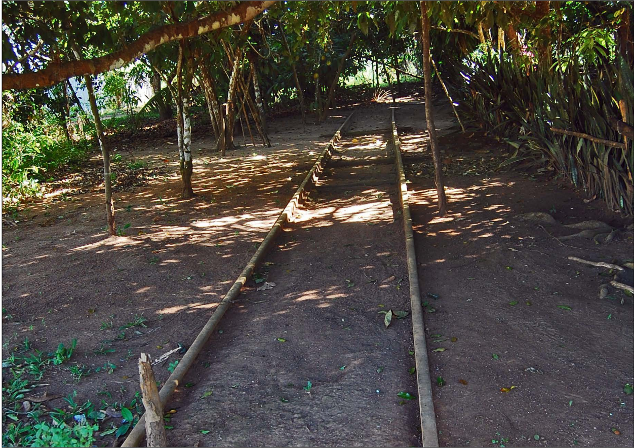
Figura 2. Linha de trem da ferrovia Madeira-Mamoré, que corta o sítio arqueológico, i.e. uma antiga aldeia indígena localizada em área encachoeirada, nas proximidades do município de Guajará-Mirim.

a Porto Velho, ao cortar o sudoeste da Amazônia, integrando as duas cidades (e, posteriormente, o estado do Acre) à malha viária nacional. A rodovia seguiu o eixo da antiga linha de telégrafo, instalada pela comissão Rondon, entre Cuiabá e Porto Velho. Ao contrário da construção da EFMM, a maioria dos colonos vindos com a abertura da BR-364 era oriunda do Sul e do Sudeste do país (Mongeló, 2019).