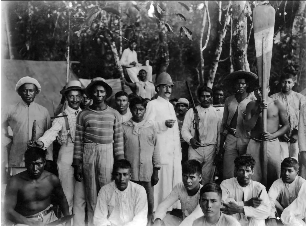
Figura 3. Trabalhadores indígenas da companhia de extração de borracha Casa Suárez, em período pré-construção da EFMM.

possui um papel fundamental em oferecer ferramentas para uma contranarrativa, através do estudo da materialidade destes processos sociais.