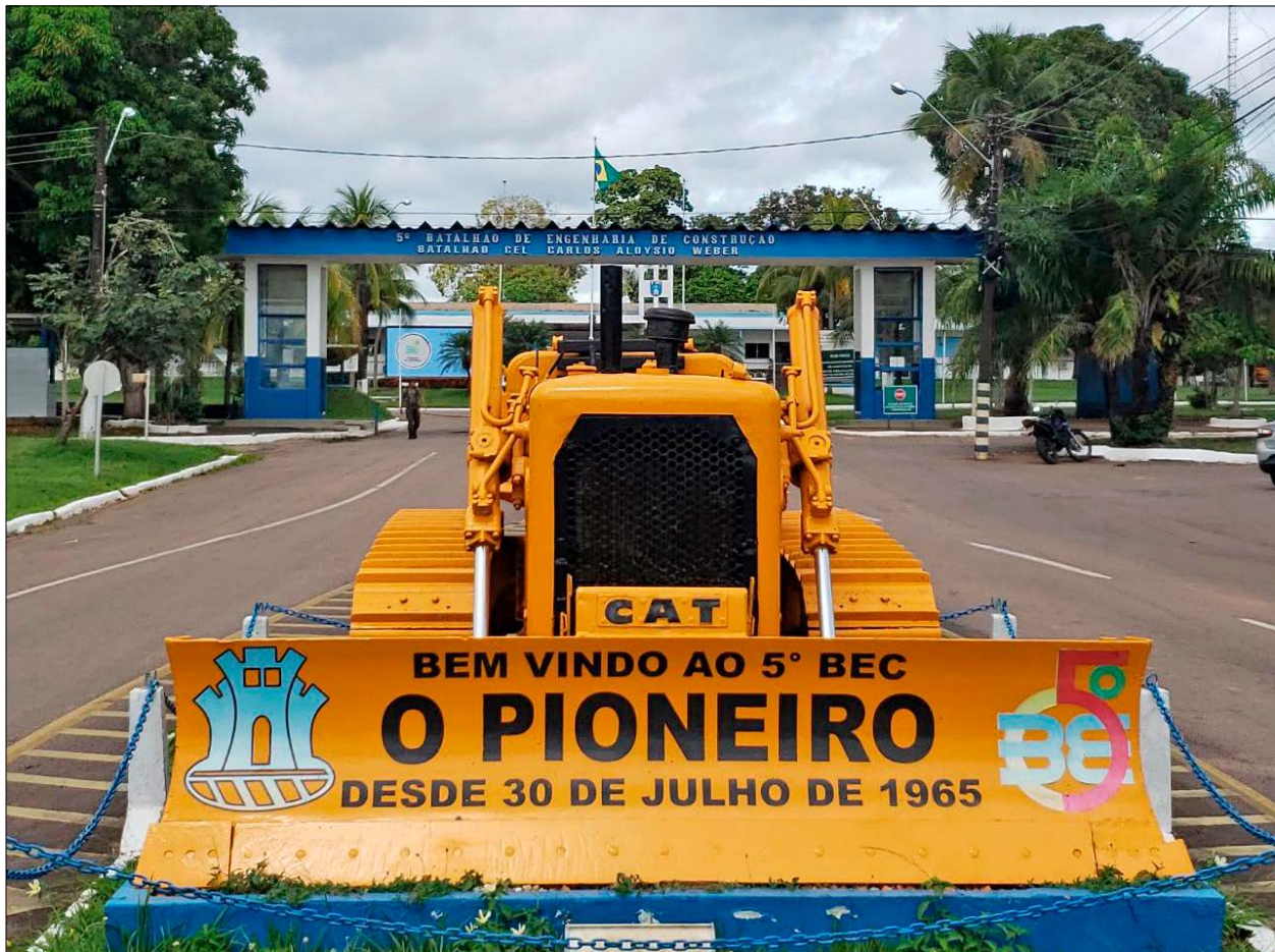
Figura 4. Trator 'pioneiro' do 5º Batalhão de Engenharia de Construção (BEC), Porto Velho, Rondônia.

Os dois massacres foram negados pelas autoridades locais e, em ambas ocasiões, as buscas pelas provas concretas das ações violentas foram o estopim para que fosse escancarada a penosa situação dos indígenas e dos camponeses. A apresentação desses vestígios materiais talvez tenha representado o trabalho 'arqueológico' mais significativo da história do sudoeste amazônico. No primeiro, o indigenista Marcelo Santos e o cinegrafista Vincent Carelli obtiveram