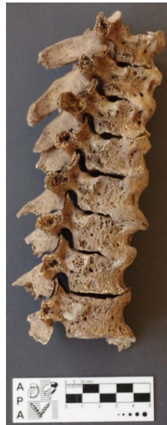
Figura 3: Vértebras anquilosadas por DISH en el individuo 4.