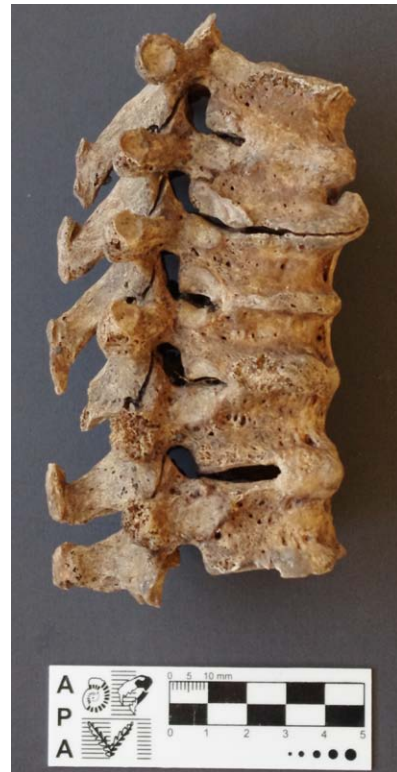
Figura 2: Vértebras anquilosadas por DISH en el individuo 2. Detalle de la unión vertebral por "puzzle piece kiss".